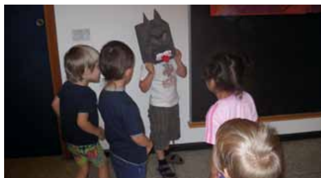
Giochiamo a “far finta” con le paure: una maschera per trasformarsi in lupo.

della rabbia). Le educatrici hanno coinvolto anche le famiglie organizzando una gita notturna con le torce al termine delle attività sulla paura. L'esperienza ha visto i bambini protagonisti di un percorso che è diventato il filo conduttore di giochi e attività, consentendo al gruppo di trasformare l'esperienza vissuta in bagaglio e ricchezza personale.