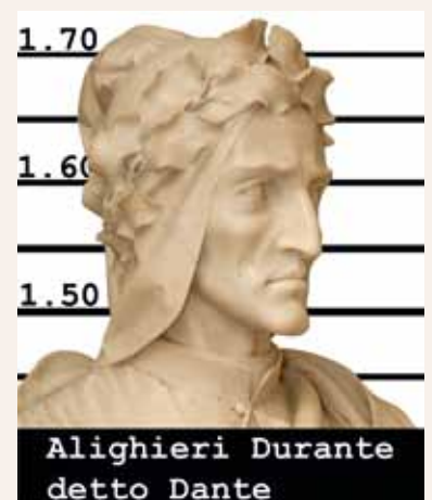
Foto segnaletiche riprese dal busto di Dante in marmo (Andrea Malfatti, 1865), esposto presso la Biblioteca comunale. Foto e ritocco di Luciano Palombi.