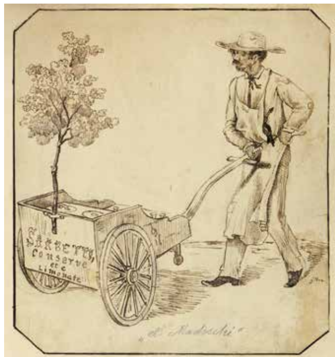
El Madoschi, venditore di limonate in piazza Duomo

Da gennaio in vendita presso tutte le sedi della Biblioteca comunale.