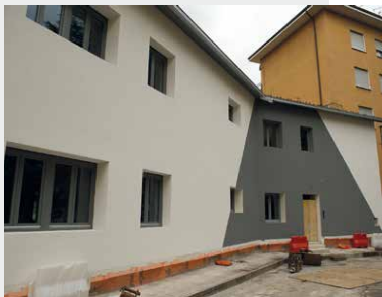
Via Martini 4

In prossimità del trasloco verrà data adeguata informazione attraverso i quotidiani e il sito internet del Comune.