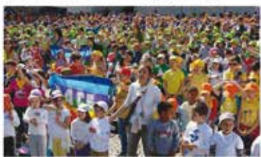
Portatori di pace e tanto entusiasmo per il nostro capitale umano per l'Unità di pace

Una pioggia di cappellini, giacchette, fiocchi e regaline colorati, ma anche di nastri e nastri, che hanno invaso piazza Duomo di ieri. In piazza Duomo, dove da bambini di strada alcuni, venivano accolti che si sono riuniti per festeggiare la festa dell'amicizia e della pace di Trento, città della pace. La manifestazione, presenziata dai bambini e dagli insegnanti aderenti al «Progetto Tuttopace», si è svolta in un'atmosfera di gioia e partecipazione ai valori. È una manifestazione di questo genere che si è svolta nel centro storico della Piazza Duomo, con un pensiero anche alle studentesse nigeriane rapite.