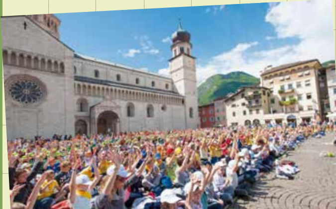
La piazza invasa dai portatori di pace In Duomo 2.500 studenti giunti da tutto il Trentino