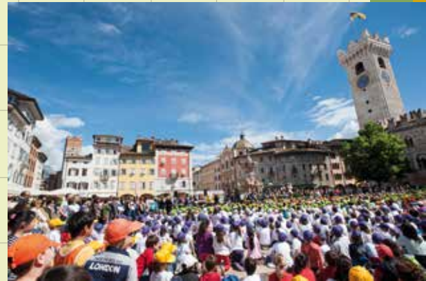
Arrivati dalla città ma anche da Andalo, Molveno, Dro, Lavis e persino Mantova