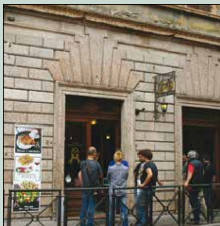
BAR DEI CAVAI