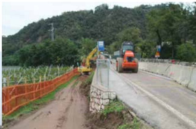
Cantiere in via Cà Rossa