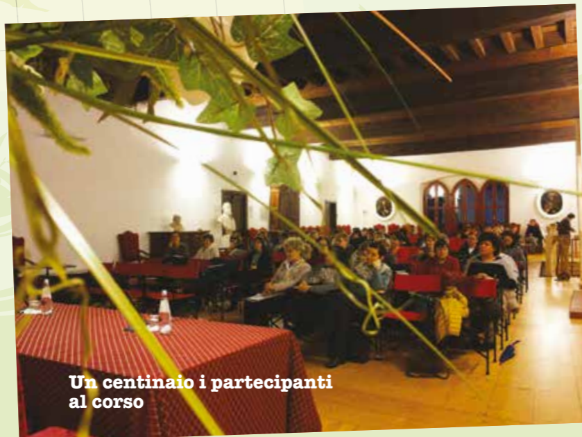
Un centinaio i partecipanti al corso