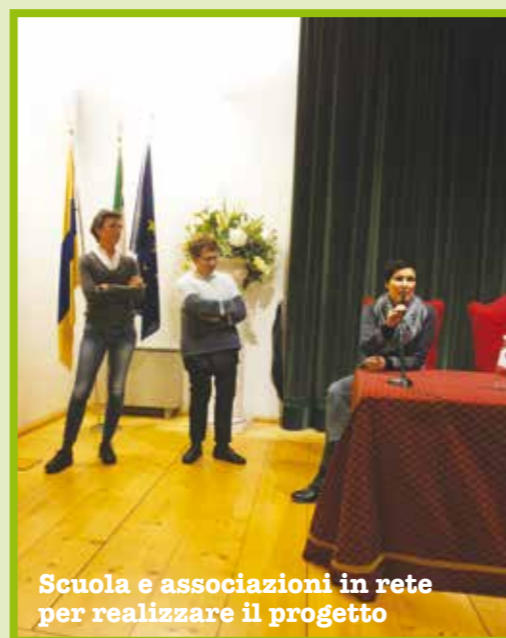
Scuola e associazioni in rete per realizzare il progetto