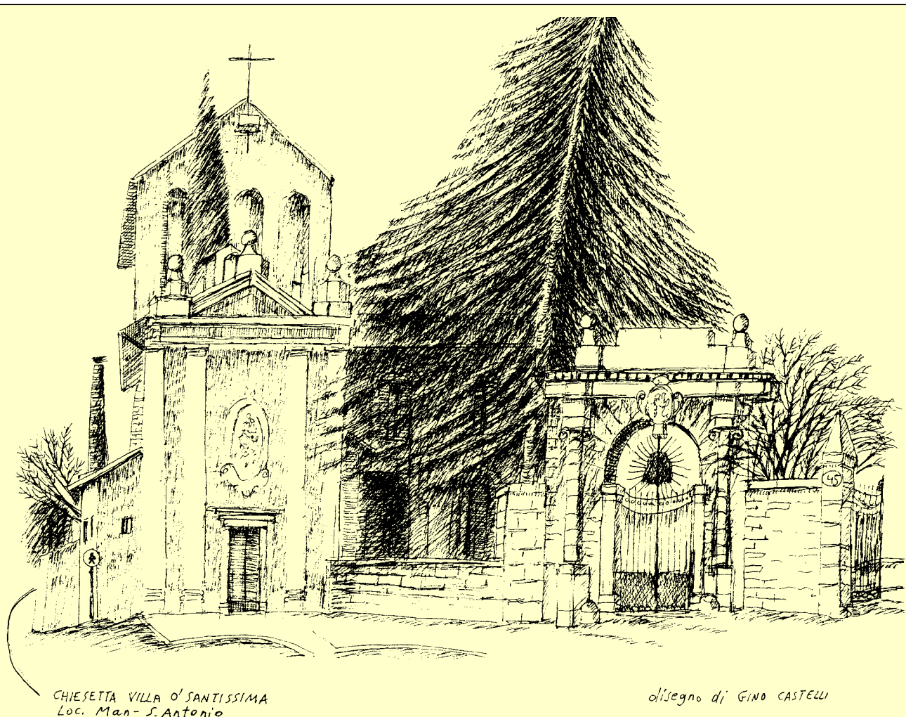
CHIESETTA VILLA O' SANTISSIMA Loc. Man - S. Antonio