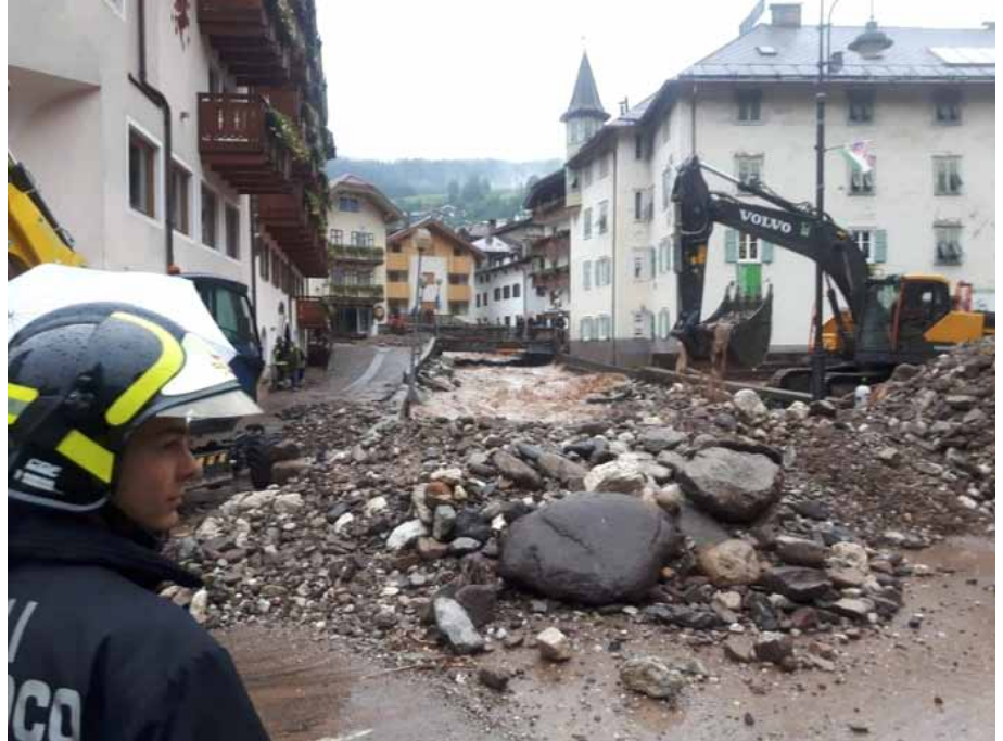
Moena 2018

La dimensione sociale e partecipativa della gestione dei rischi alluvionali, nella prospettiva dei prossimi 20 anni, è il baricentro del progetto LIFE FRANCA, che intende migliorare la comunicazione del rischio alluvionale nelle comunità locali e favorire una cultura dell'anticipazione e prevenzione. "Anticipare" con una visione dei prossimi due decenni serve oggi perché le incertezze sono sempre maggiori e i cambiamenti (sociali, territoriali) necessari per adattarsi e gestirle richiedono tempo. L'efficacia della prevenzione e mitigazione dei rischi dipende dalla collaborazione