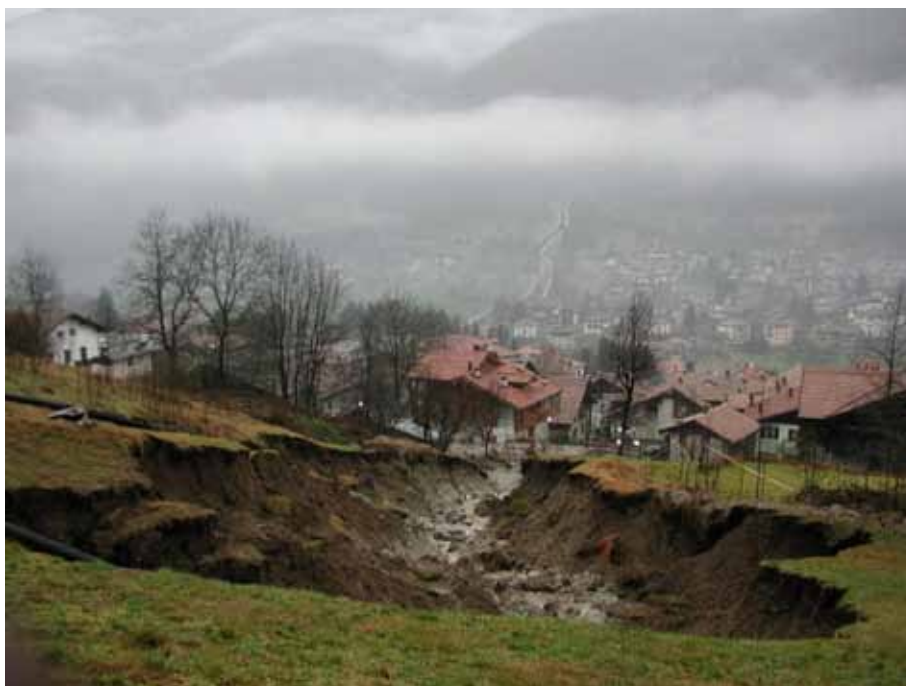
Bocenago 2002 (foto Servizio Bacini Montani)

Tre sono le aree di studio: Trento, Borgo Valsugana e Bocenago, scelte perché molto diverse dal punto di vista idrogeologico e sociale, rappresentanti della variabilità delle comunità alpine; ma la comunicazione è dedicata all'intera provincia di Trento e i risultati intendono essere utili ad ogni territorio a rischio idrogeologico.