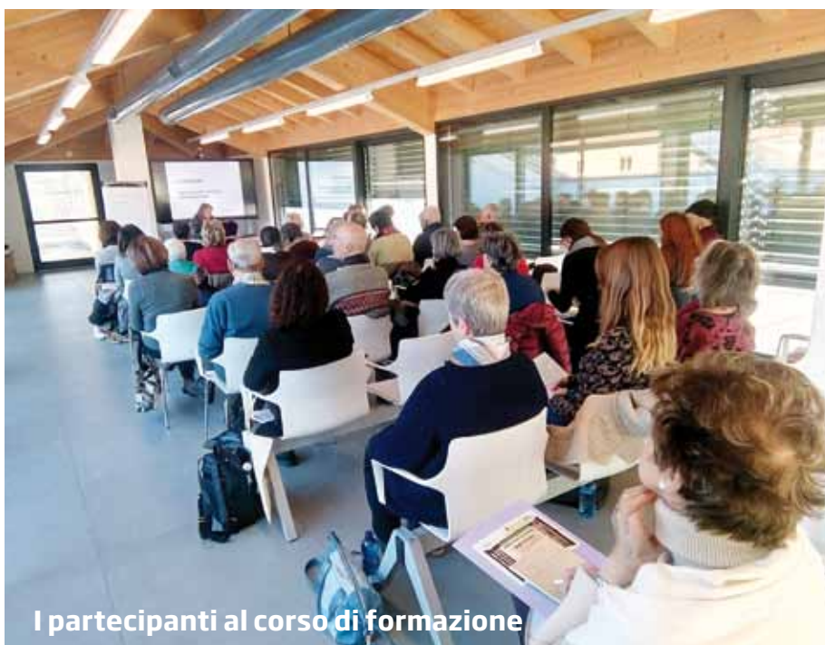
I partecipanti al corso di formazione

Al Centro Contrada larga di via Belenzani (n. tel. 0461/235348 ) ogni sabato e domenica, dalle 14 alle 17.45, è possibile incontrarsi, leggere i quotidiani, giocare a carte o a tombola. Domenica pranzo insieme in alcuni ristoranti della città e nel pomeriggio musica, ballo, spettacoli. Il servizio è attivo anche nelle festività di San Vigilio e Ferragosto.