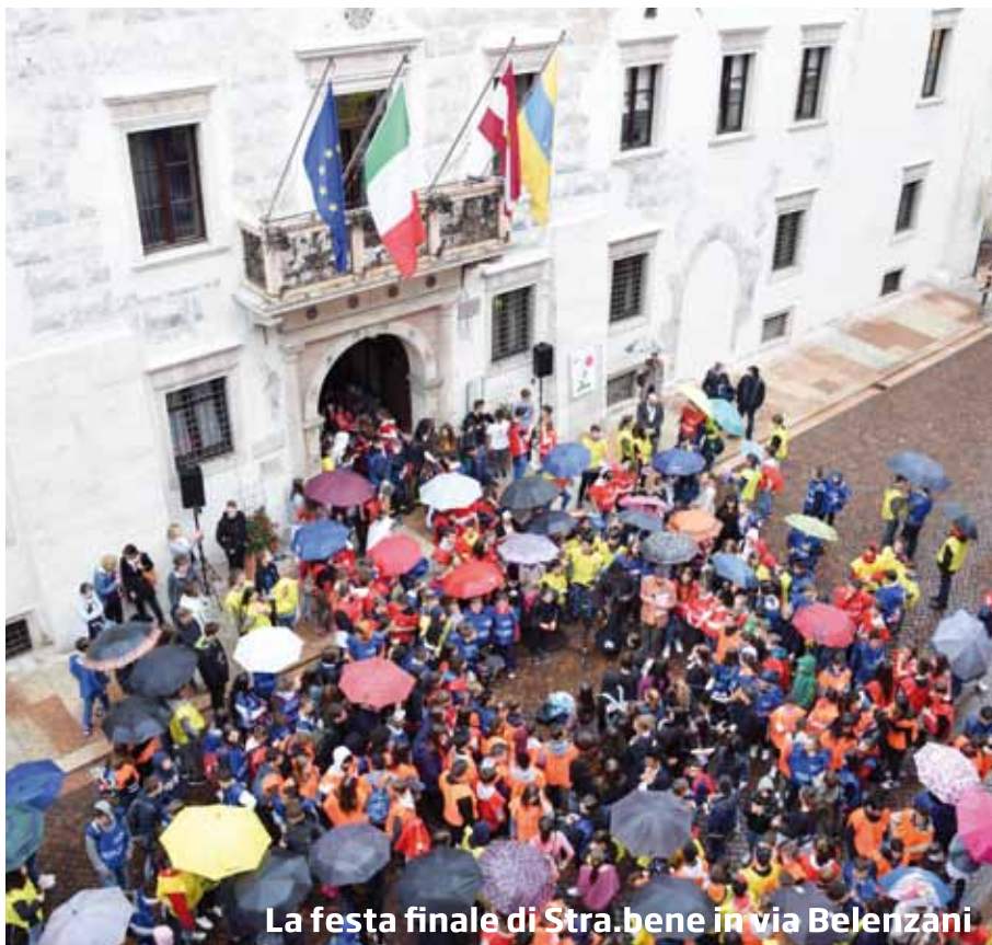
La festa finale di Stra.bene in via Belerzani

Sulla pagina facebook Beni comuni Trento e attraverso la newsletter ( www.comune.trento.it/newsletter/subscribe ) è possibile approfondire le tematiche relative ai beni comuni, seguire iniziative, proposte ed eventi, trarre input interessanti per avviare nuove collaborazioni.