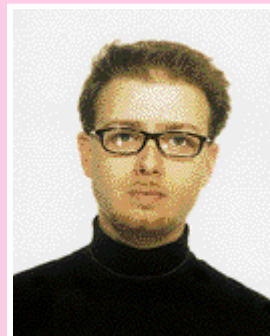
Reggio Alessandro - Civic. Buon.