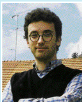
Tamanini Carlo - Verdi