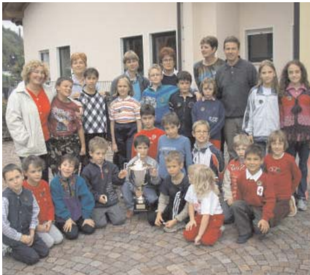
Una parte del folto gruppo di ragazzi, parenti, amici e insegnanti della Scuola I. Calvino di Vigo Meano che hanno partecipato alla marcia "Sulla via Claudia Augusta" 2002.

All'arrivo ogni partecipante ha ricevuto la