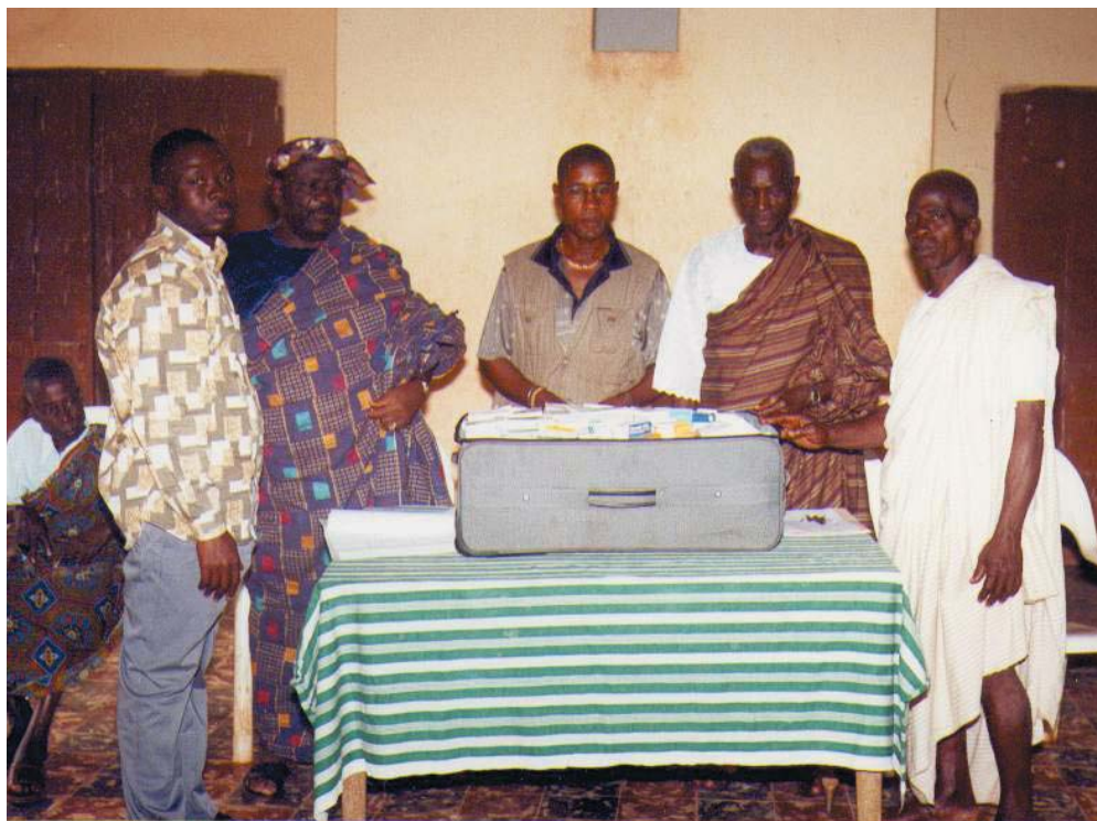
Consegna di medicinali e materiale didattico ai rappresentanti di due villaggi del Togo e della Costa d'Avorio, frutto di numerose manifestazioni e iniziative organizzate dal Circolo Sobborgo Aperto a favore delle popolazioni dei due paesi africani.

Non mancheremo, poi, di proporre numerosi spunti di riflessione su quelle tematiche che ha nostro avviso hanno bisogno di un confronto continuo, riguardanti ad esempio: lo sviluppo dei paesi