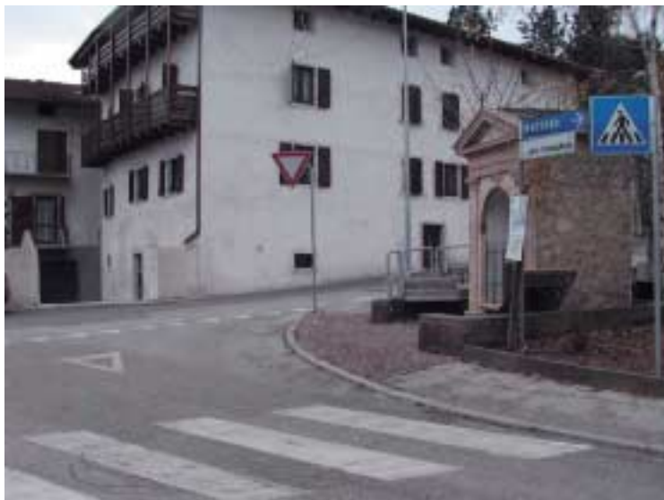
Centro giovani a Martignano, tra poco a disposizione in Piazza Canopi.