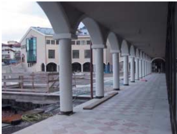
Il Centro giovani a Cognola troverà spazi invece nel costruendo Centro Civico.