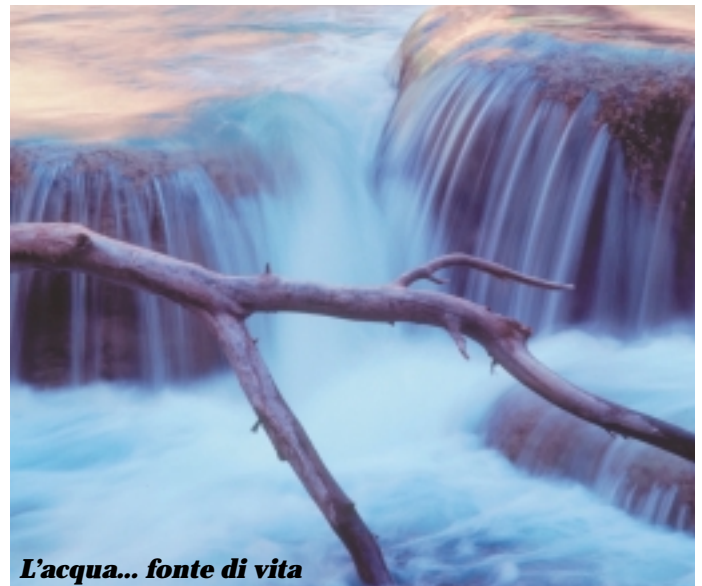
L'acqua... fonte di vita

Sunto del documento deliberato dal Consiglio Circoscrizionale in data 08 maggio 2000