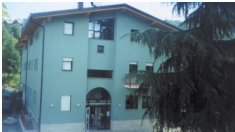
Nuova Scuola Materna Equiparata di Sopramonte