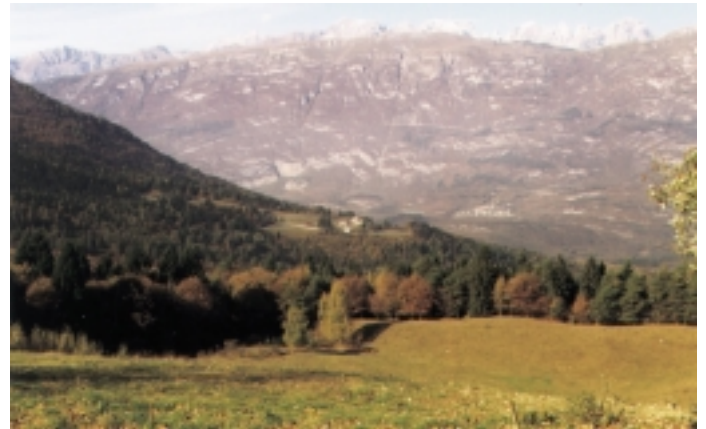
S. Anna di Sopramonte - panoramica

Si ritiene importante ricavare all'interno dell'area artigianale uno spazio per la raccolta differenziata dei rifiuti, con un'eventuale area per il compostaggio del verde, nonché per il deposito di quantitativi limitati di materiale inerte.