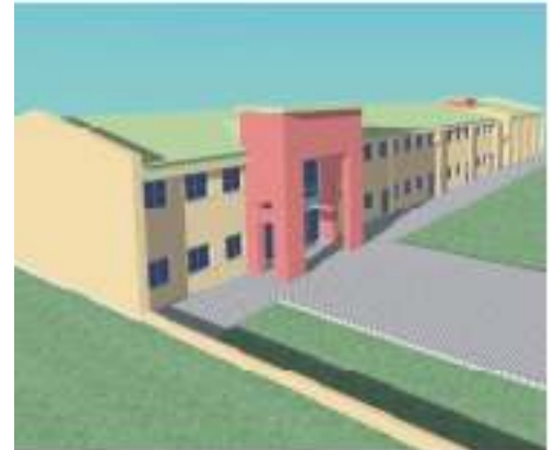
Scuola elementare di Cadine

Attualmente la scuola è dotata 10 aule (che ospitano due sezioni) e di 6 aule speciali; l'aumento costante del numero di iscritti ha spinto l'Amministrazione a creare gli spazi per ospitare la terza sezione. Nel piano interrato sarà realizzata una cucina a servizio della mensa esistente e sarà ricavato anche un locale delle dimensioni di circa 100 mq, dotato di accesso interno verso la mensa e di accesso diretto dall'esterno, per eventuali utilizzi extrascolastici. Durante il periodo di chiusura estiva saranno realizzati gli scavi, le demolizioni e la costruzione della nuova struttura. Con l'avvio del nuovo anno scolastico saranno realizzate le finiture. Durante le vacanze estive 2008 infine, a completamento del lavoro, nel piano interrato sarà realizzata la cucina.