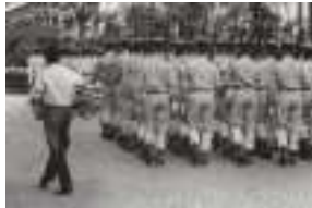
GIANNI BERENGO GARDIN - 1974