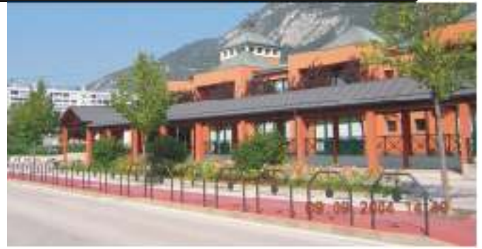
Scuola elementare dei Solteri