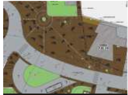
Arredo urbano a Oltrecastello

Particolarmente pregevole sarà la copertura "morbida" a onda. Al piano interrato, oltre al garage, saranno posti i locali per la centrale termica, l'ascensore, il trattamento aria e il quadro elettrico. Al piano terra l'atrio d'ingresso, uno spazio mostre, cucina elettrica e dispensa. La sala da pranzo potrà ospitare quasi cento posti a sedere. Infine, 3 aule normali, l'aula magna e la bidelleria. Al primo piano 6 aule, l'aula insegnanti, palestra e biblioteca. Al secondo 3 aule normali, 2 di sostegno, 2 speciali, l'aula riunioni. La conclusione del lavoro, iniziato negli ultimi mesi del 2006, è prevista per la primavera 2009.