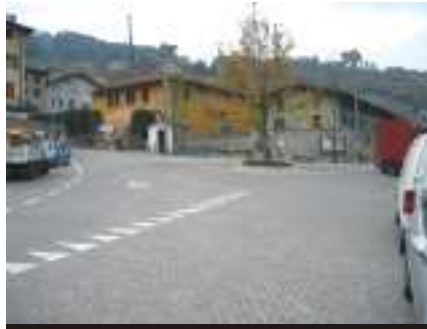
Piazza Costantino Condini (Romagnano)