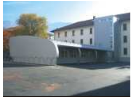
Sede provvisoria elementare "F. Crispi"