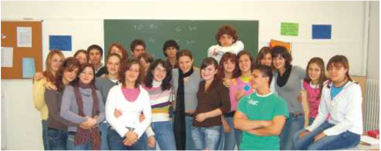
I NOSTRI AMICI DELLA CLASSE 2 BD del Liceo Rosmini