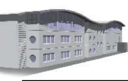
Scuola elementare di Sopramonte