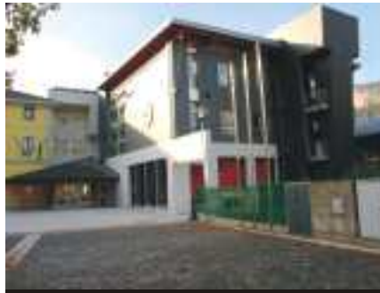
Scuola elementare Sant'Anna (Gardolo)