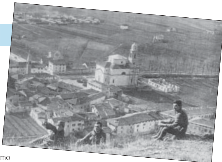
1917-1918. Veduta di Gardolo con sullo sfondo, il campo prigionieri austroungarico

L'Associazione Culturale "Il Gruppo" di Roncafort ha organizzato nel novembre 2002 una mostra che non ha voluto essere solo una ricostruzione storica del periodo 1900-1950.