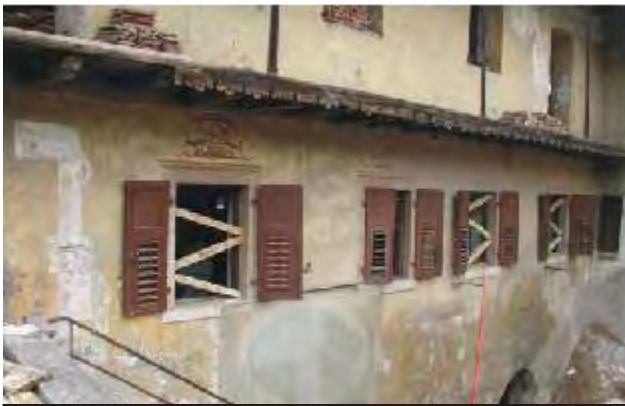
CASA PELLILLO (GARDOLO)