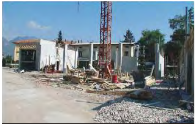
NUOVA CASERMA VVFF (GARDOLO)

sala riunioni ed una sala per i corsi, i servizi igienici, una cucina ed un piccolo dormitorio con 5 posti letto. L'edificio con gli uffici si affaccerà su via Bepi Todesca. Qui sarà realizzato un ampio marciapiede che migliorerà l'accessibilità e la vivibilità di questo nuovo spazio urbano. I due volumi saranno collegati da un corridoio e nel mezzo del cortile troverà posto anche il "castello di manovra" per l'addestramento. Il progetto ha rispettato le disposizioni emanate dal corpo permanente provinciale dei Vigili del fuoco.