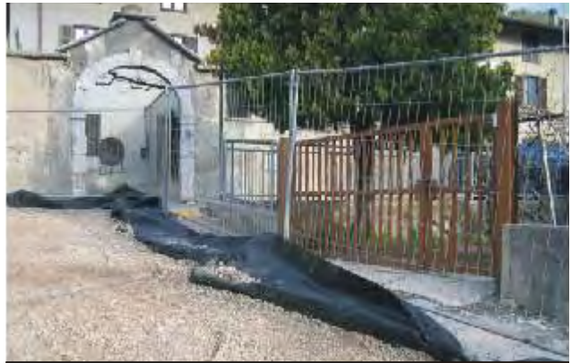
ARREDO URBANO (ROMAGNANO)