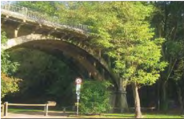
PONTE S.S. FRICCA (GOCCIADORO)