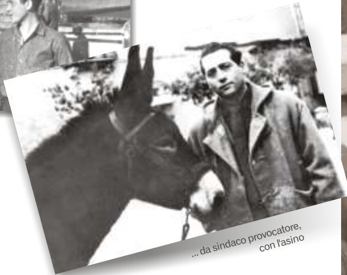
... da sindaco provocatore, con l'asino