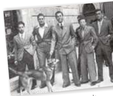
Rocco e i compagni di scuola, angolo via Mancini Oss Mazzurana

Scotellaro, poeta e politico, studente a Trento nel 1940-41