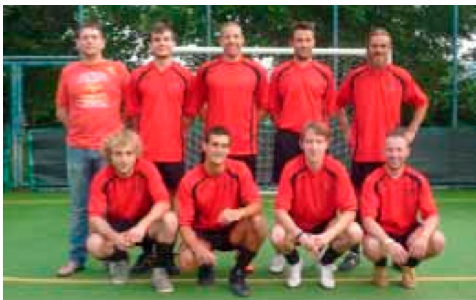
Meano 3° classificata