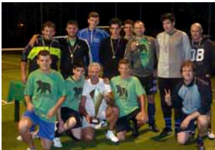
Cortesano 1° classificata

Venerdì 13 luglio si sono disputate le due semifinali dove la prima di ogni girone ha affrontato la seconda dell'altro girone, questi i risultati: Meano - Vigo Meano 4-7; Cortesano - Gardolo di Mezzo 8-3.