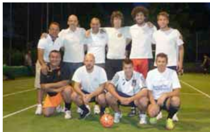
Gardolo di Mezzo 4° classificata