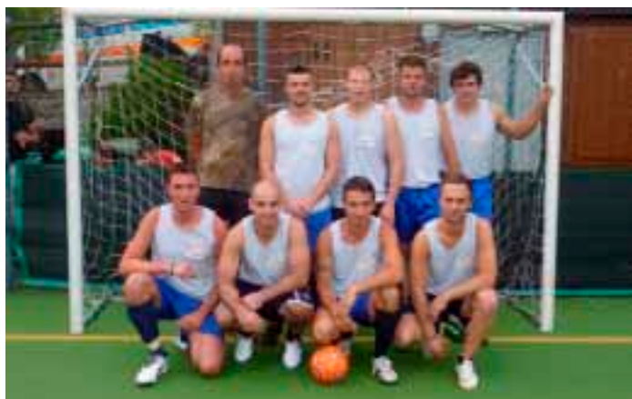
S. Lazzaro 5° classificata

Domenica 15 luglio è stato il grande giorno delle finali dove, in quella per il 3°- 4° posto Meano ha superato Gardolo di Mezzo per 8-5, mentre in quella per il 1°- 2° posto, Cortesano ha battuto Vigo Meano per 6-1 e si è aggiudicata la seconda edizione del Torneo delle Frazioni di calcio a 5.