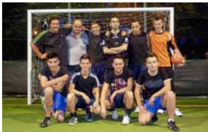
Gazzadina 6° classificata