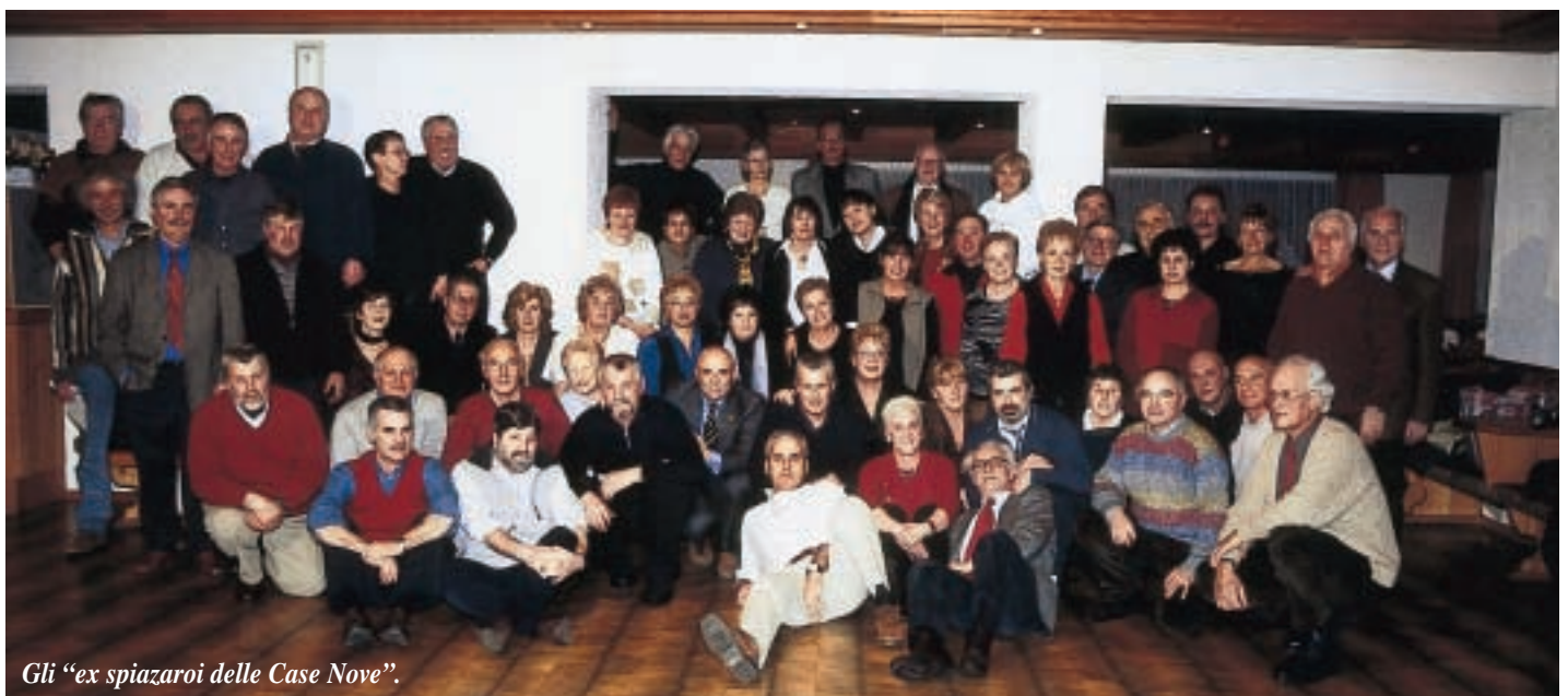
Gli “ex spiazaroi delle Case Nove”.