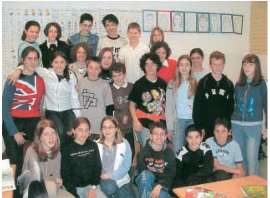
La classe II a D.

Negli incontri successivi i ragazzi hanno imparato la cucina, il cucito, il lavoro a maglia, la falegnameria e i giochi di una volta.