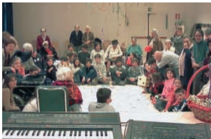
Nonni e ragazzi in festa.

D urante l'anno scolastico 2003/4 presso le scuole medie Bronzetti/Segantini di via Vittorio Veneto è stato portato avanti il progetto “Non fare lo struzzo” in collaborazione con l'adiacente R.S.A. La finalità dichiarata era quella di avvicinare gli studenti al pianeta an-