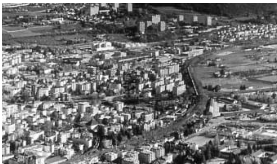
Veduta della circoscrizione