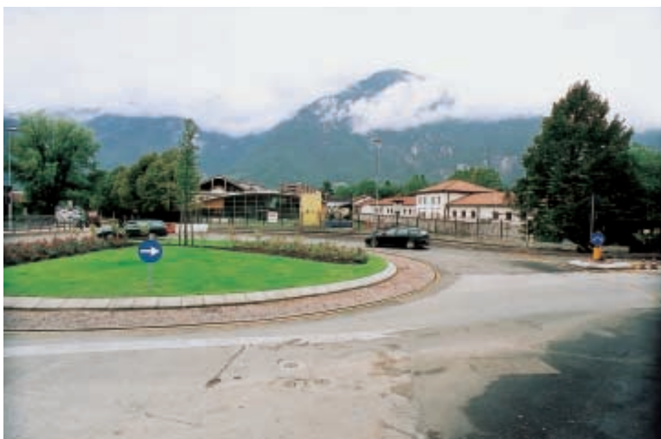
La nuova rotatoria di via Fermi - New Photo

Ovvero, quando la fotografia è testimonianza del tempo