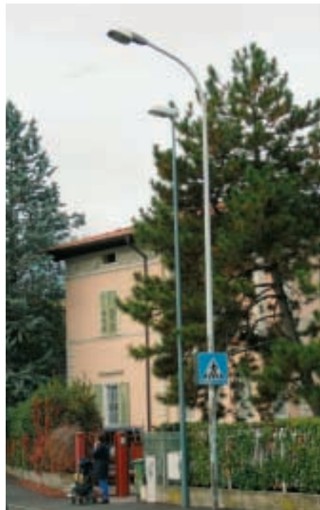
I lampioni in zona Clarina, davanti alla scuola elementare.