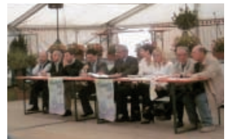
Conferenza stampa di presentazione del calendario