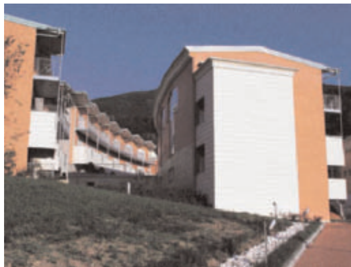
Residenza Erica e Genziana