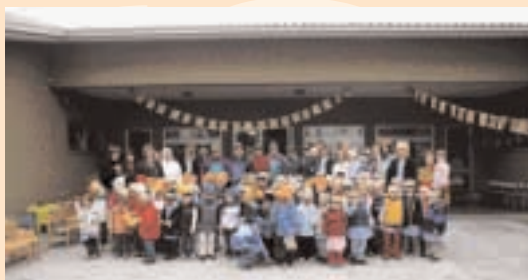
Immagini della castagnata presso la scuola materna.