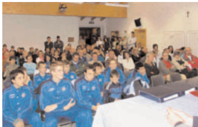
Immagini della serata di presentazione delle attività sportive con premiazione di atleti-dirigenti