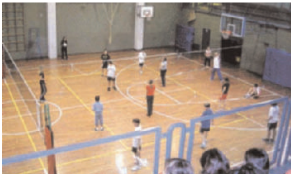
Immagini dei momenti di incontro – socializzazione e attività in comune tra gli studenti delle scuole medie di Znojmo e Pascoli di Villazzano/Povo