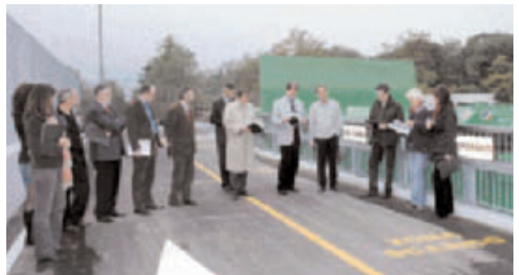
Inaugurazione del nuovo centro di raccolta il 25 ottobre 2005