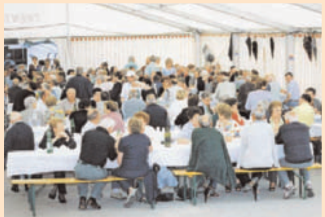
Immagine della Festa di Primavera 2005

La prossima edizione, che si farà sicuramente, altre realtà bisognose, potranno sicuramente beneficiare del lavoro dei volontari che si impegnano per la riuscita della 15 a Festa di Primavera.