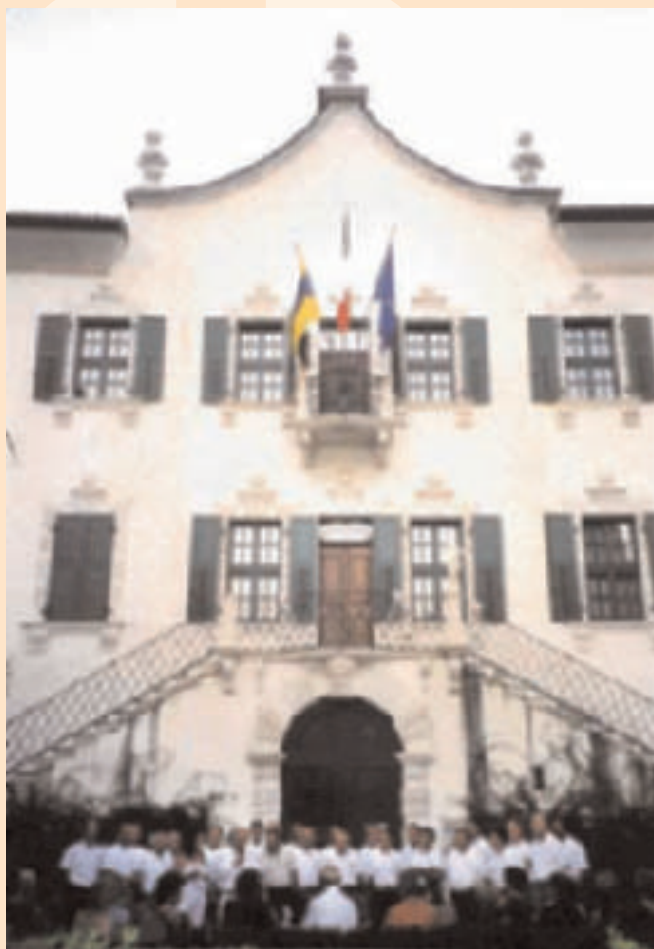
Coro Costalta di Baselga di Pinè in concerto a Villa De Mersi