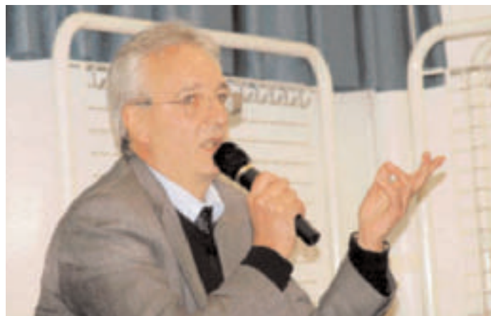
Intervento del vicepresidente della C.R. TN