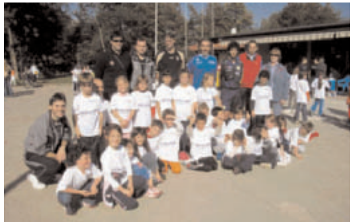
Foto di gruppo con maglietta ricordo