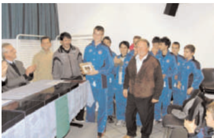
Premiazione della squadra Pallacanestro Villazzano