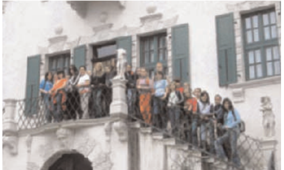
I ragazzi della scuola di Znojmo in visita a Villa de Mersi

connotato la Regione Trentino-Alto-Adige come terra dall'identità culturale "plurima" in quanto accoglie e fa convivere al suo interno diversità che ne fanno un laboratorio politico e sociale.