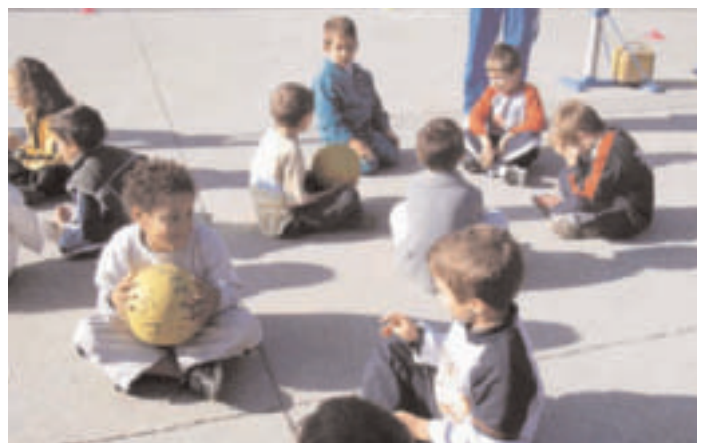
Momenti della giornata di promozione sportiva