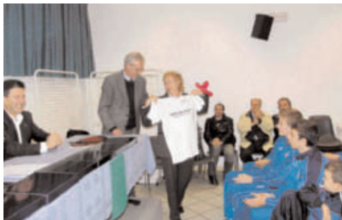
La Dirigente scolastica delle scuole elementari