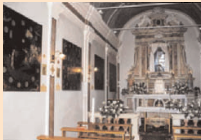
Passeggiata tra le chiese di Gabbio, Villa Belvedere e Grotta. Chiesa di Gabbio