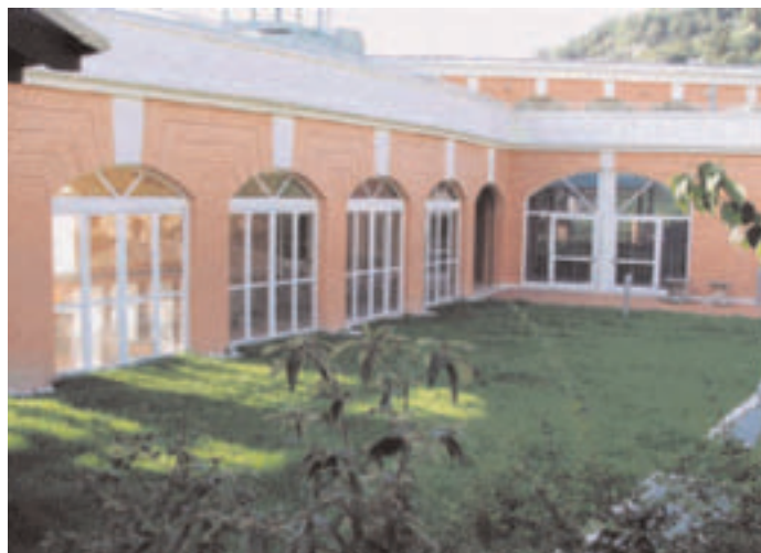
Prato est palestra