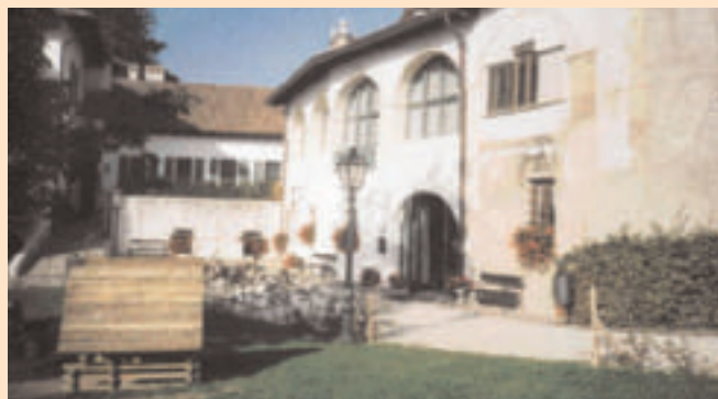
La sede presso Villa De Mersi