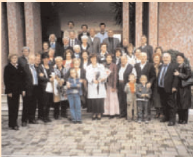
Gruppo AVIS Villazzano alla festa dei donatori 2004 a Volpago (TV).