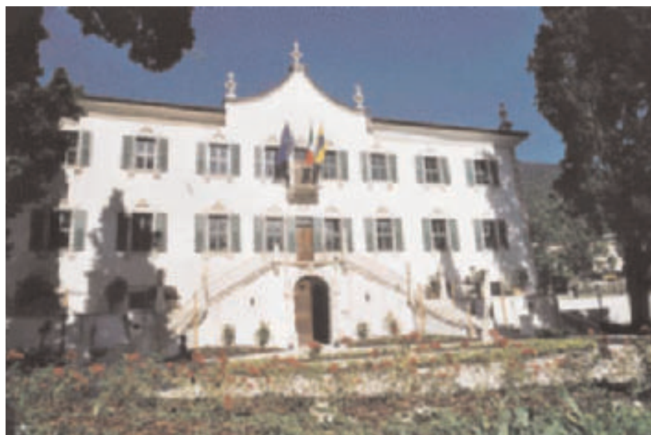
Villa de Mersi sede della Circostrizione di Villazzano