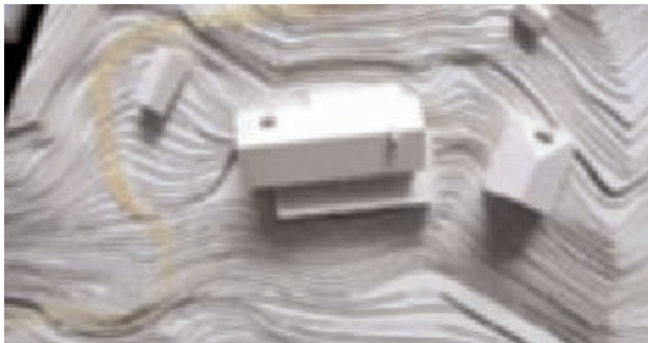
plastico del nuovo Rifugio Maranza in fase di costruzione

gio che si potrà ammirare nei dintorni. Dopo l'assegnazione dei lavori alla ditta vincitrice dell'appalto e le lungaggini burocratiche che hanno ritardato non poco l'inizio lavori, il cantiere dovrebbe essere definitivamente aperto in questi giorni. Si prevede la chiusura dei lavori entro la fine del 2007.