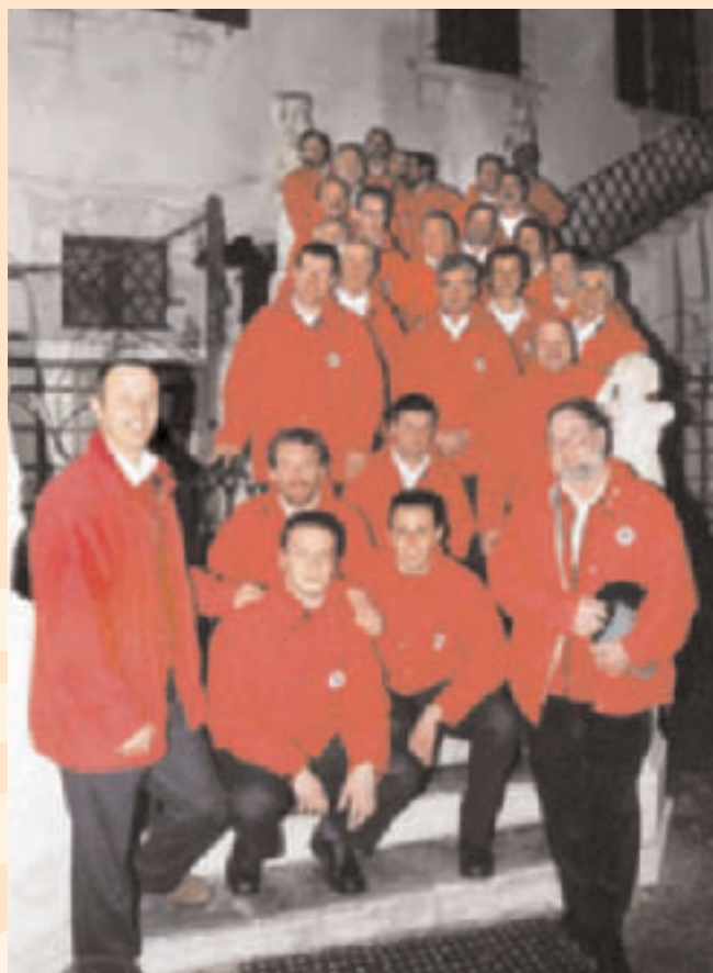
Coro Costalta di Baselga di Pinè a Villa De Mersi

Un concerto il 26 novembre a villa de Mersi, sarà l'occasione per consegnare due targhe di riconoscimento a due giovani allievi del conservatorio che quest'anno hanno inserito nel loro repertorio musicale bonportiane. Il 2005 si chiuderà con il Concerto di Natale che si eseguirà nella Chiesa parrocchiale.