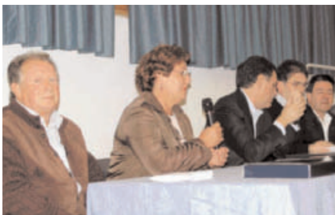
Intervento della rappresentante del CONI Provinciale