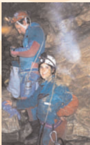
Gruppo speleologico in azione