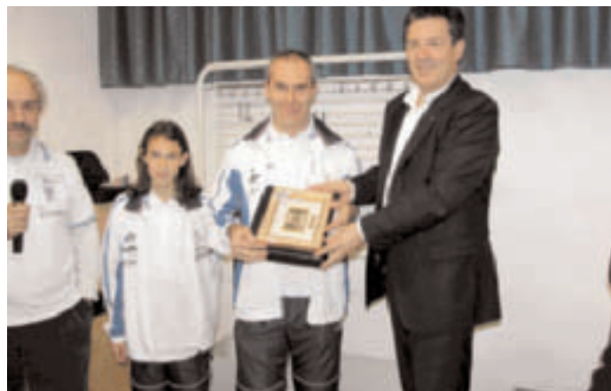
Premiazione della squadra orienteering