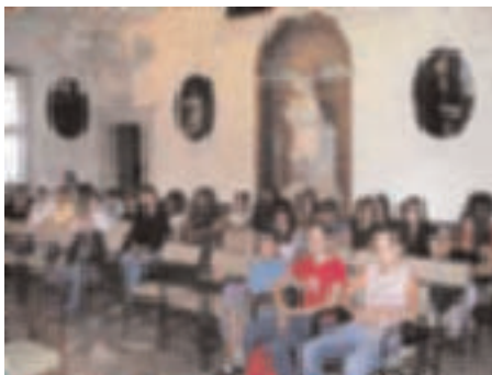
I ragazzi della scuola di Znojmo in visita a Villa de Mersi