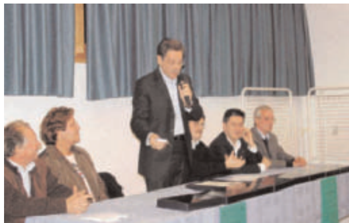
Intervento del presidente della Circoscrizione