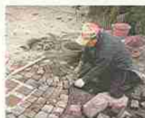
"Fotocronaca" della posa dell'ultimo cubetto...