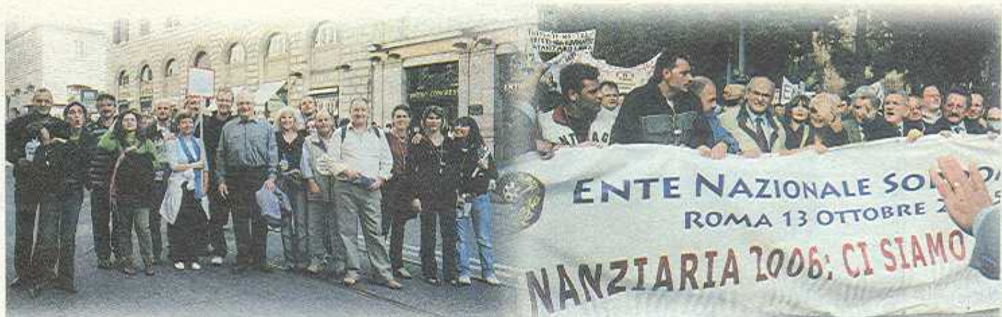
Manifestazione nazionale - Roma 13 ottobre 2006