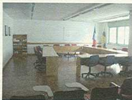
Sala consiglio

nell'intento di essere più attenti alle necessità dei residenti. È un modo per avere una presenza capillare sul territorio, per conoscere problemi e necessità che certamente sono diverse e diversificate da zona a zona, per stabilire un contatto il più diretto possibile con gli abitanti.