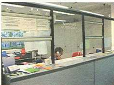
Uffici della circoscrizione

In questa ottica vanno letti tutti gli eventi organizzati fino ad ora (Festa di Primavera, festa di via Veneto, Festa dei bambini al parco di Piazza Venezia, Festa di inizio anno scolastico al parco di Maso Ginocchio, Castagnata alla Busa, concerti di Natale e di fine anno) e tutte le conferenze, i dibattiti, le feste realizzati all'interno della struttura circoscrizionale. Nella convinzione che tutto ciò sia veramente utile, confermati in questo anche dal successo che ogni evento ha avuto, anche per i prossimi mesi sono previsti vari momenti di festa e di informazione, come appare negli appuntamenti che il giornale riporta più avanti. Si sente tuttavia ancora la mancanza di essere organo referente per tutti i problemi che i cittadini hanno