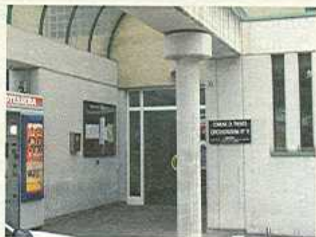
Sede della circoscrizione S. Giuseppe e S. Chiara

In parole povere il Comune ha voluto che nelle varie zone della città e nei sobborghi sia presente una rappresentanza dell'Amministrazione comunale