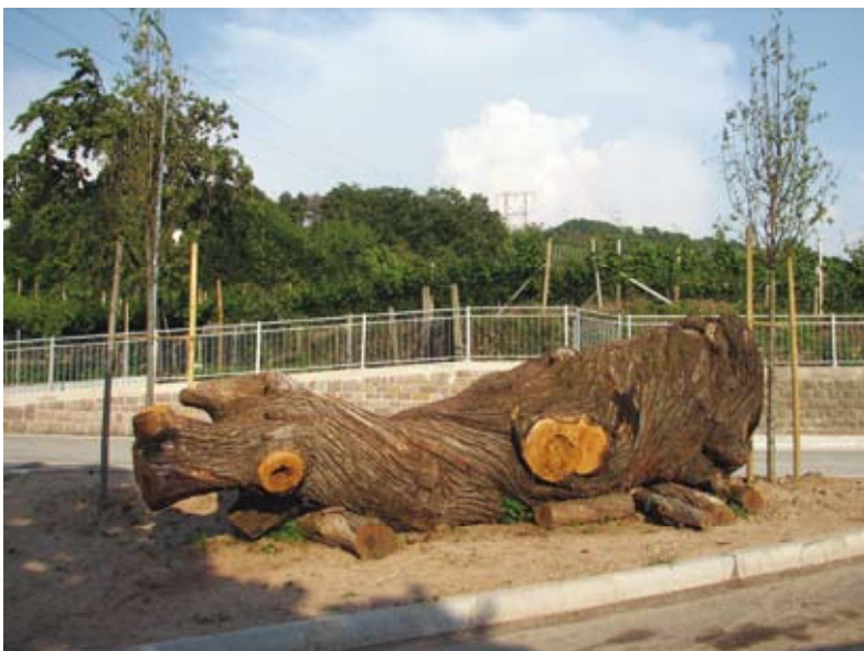
Tronco di castagno tagliato recentemente in località Camparta media perché pericolante. Attualmente è collocato provvisoriamente presso il cimitero di Meano. Si raccolgono idee e suggerimenti per un'adeguata valorizzazione e collocazione definitiva.