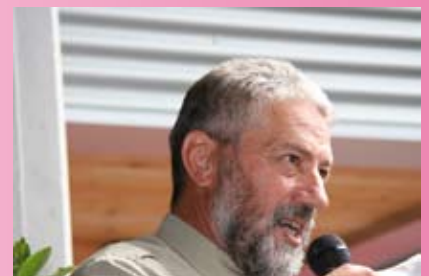
... visibilmente più rilassato dopo il pranzo. È ANDATO TUTTO BENE !