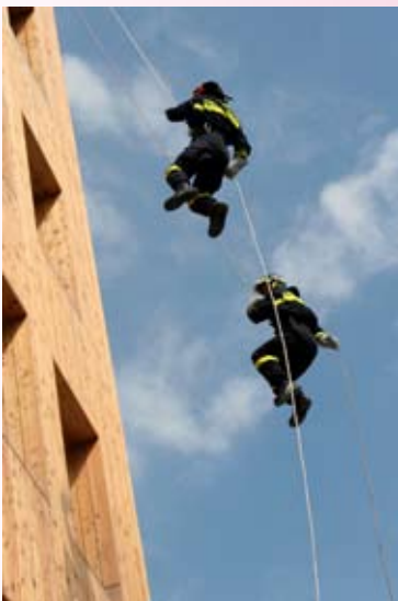
... le manovre al castello