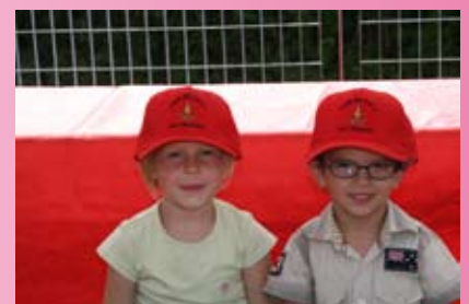
... le nuove leve