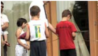
Il taglio del nastro

La gestione affidata alla Cooperativa ARIANNA