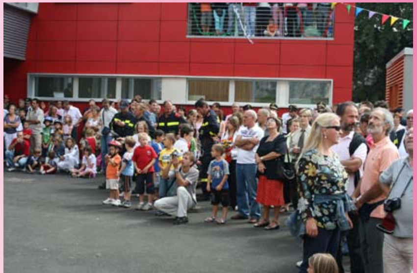
... la gente con il naso all'insù