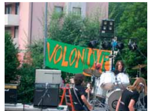
La festa no alcol del volontariato giovanile.

Sul secondo invece come Commissione abbiamo la possibilità di intervenire in maniera sostanziale attivando iniziative rivolte a quelle persone che portano con se tutti i problemi legati alla loro condizione fisica determinata dall'età o dalle malattie. L'insicurezza nel muoversi in maniera autonoma trasmessa dalla propria debolezza o condizione fisica li costringe