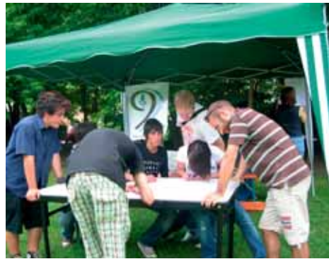
Giovani volontari al lavoro...

La nostra Gardolo, intesa come territorio circoscrizionale, sta cercando di contrastare l'avvento di nuove periferie in cui, nell'ultimo decennio, si è sviluppata in maniera consistente un'edificazione privata e soprattutto (a Roncafort e Spini) un'edificazione pubblica nella quale si concentrano particolari categorie di bisogno e di disagio, creando contesti urbani che producono problematiche di non facile soluzione, assumendo talvolta un ruolo di moltiplicatori del rischio e del disagio della vita urbana circostante, divenendo per definirli in maniera cara ad alcuni urbanisti "non luoghi" e provocando dirompenti "discontinuità" sociali, culturali e commerciali fra i vari quartieri.