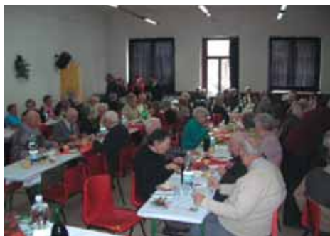
Il pranzo con gli ultra ottantenni

spesso a rintanarsi in casa nella speranza che qualcuno vada a trovarli.