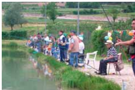
La pesca sportiva con i diversamente abili

Un ringraziamento di cuore lo vorrei rivolgere ai membri della Commissione Politiche Sociali, a tutte le Associazioni già menzionate e anche a quelle che non ho menzionato, a coloro che a titolo personale hanno collaborato in questi progetti nella speranza di averli ancora al nostro fianco.