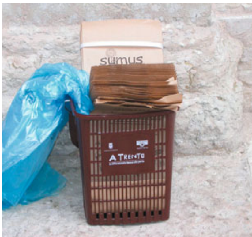
kit consegnato a ciascuna famiglia che vive in condominio

Nei condomini esiste poi, per ogni numero civico, una batteria di contenitori condominiali.