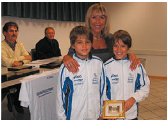
U.S. Villazzano - G.S. Scarpon Sett. Atletica Squadra Esordienti Corsa Campestre