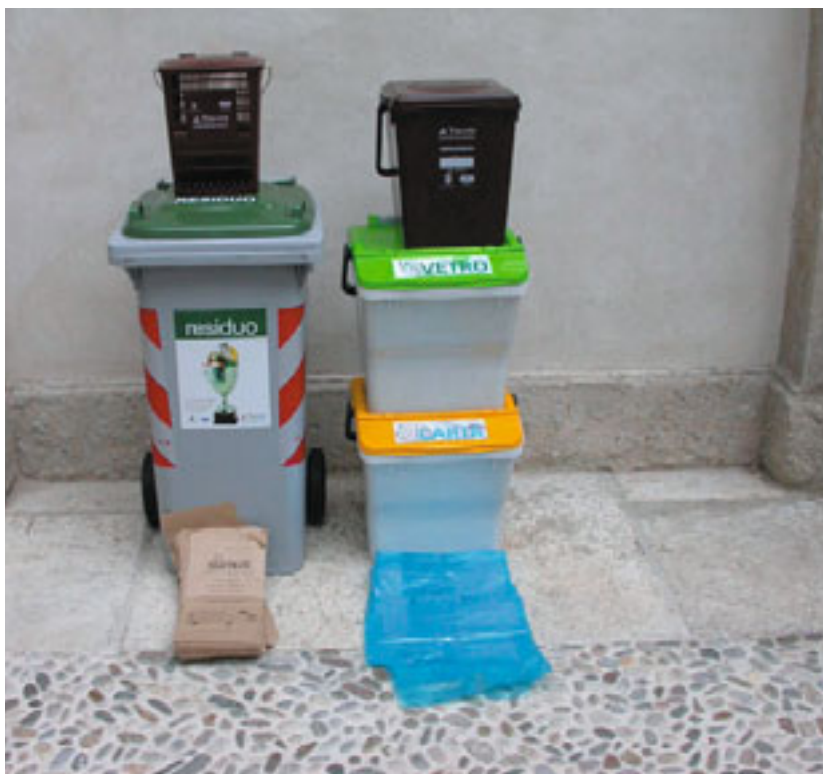
kit consegnato a ciascuna famiglia che vive in casa