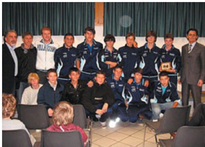
U.S. Villazzano - Calcio Camp. Reg.le Giovanissimi 2007/08