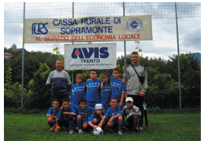
2° Classificata. G.S. Sopramonte