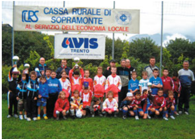
FOTO DI LE SQUADRE

Trofeo: “Oggi a Te .... domani all’Avis ?”