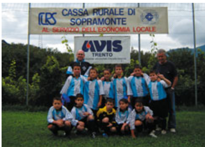
3° Classificata. G.S. Trilacum - Vincitrice del trofeo -