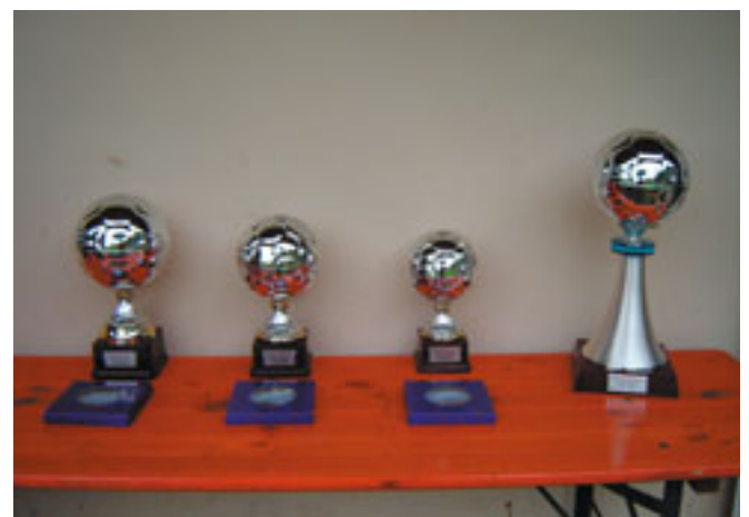
Coppe e Trofeo in pallio