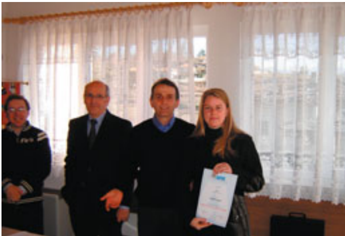
“FESTA DEL DONATORE” - 10 febbraio 2008 Distribuzione degli attestati e delle benemeritenze ai Soci

Il numero dei donatori iscritti è di 42 unità, con 4 nuove adesioni nell'arco del 2008.