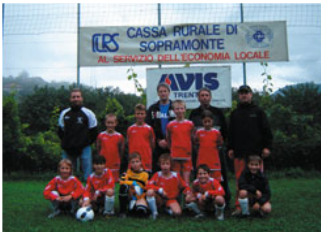
1° Classificata. U.S. Sardaña