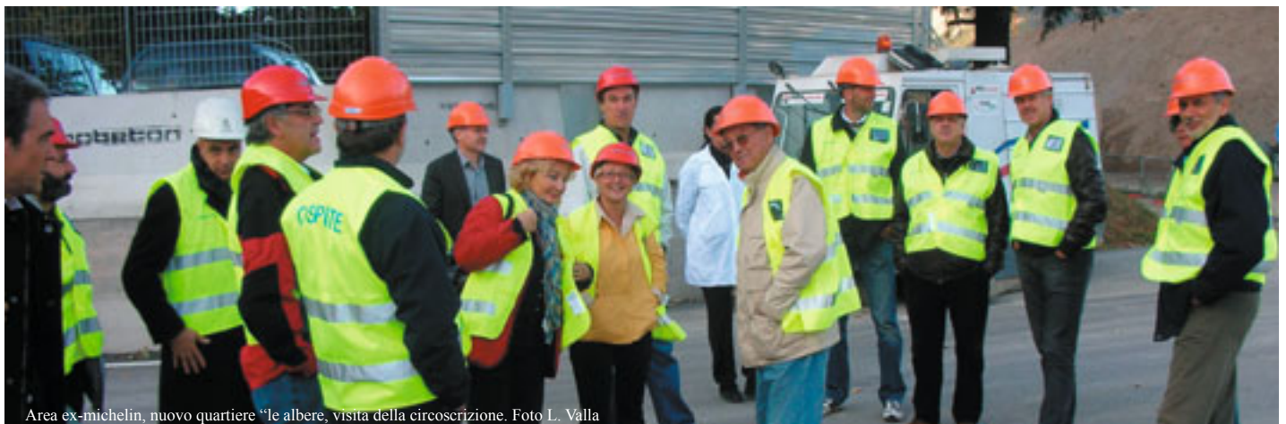
Area ex-michelin, nuovo quartiere "le albere, visita della circoscrizione.

Si richiede maggior cura nella pulizia delle aiuole e zone verdi lungo marciapiedi e/o spartitraffico.