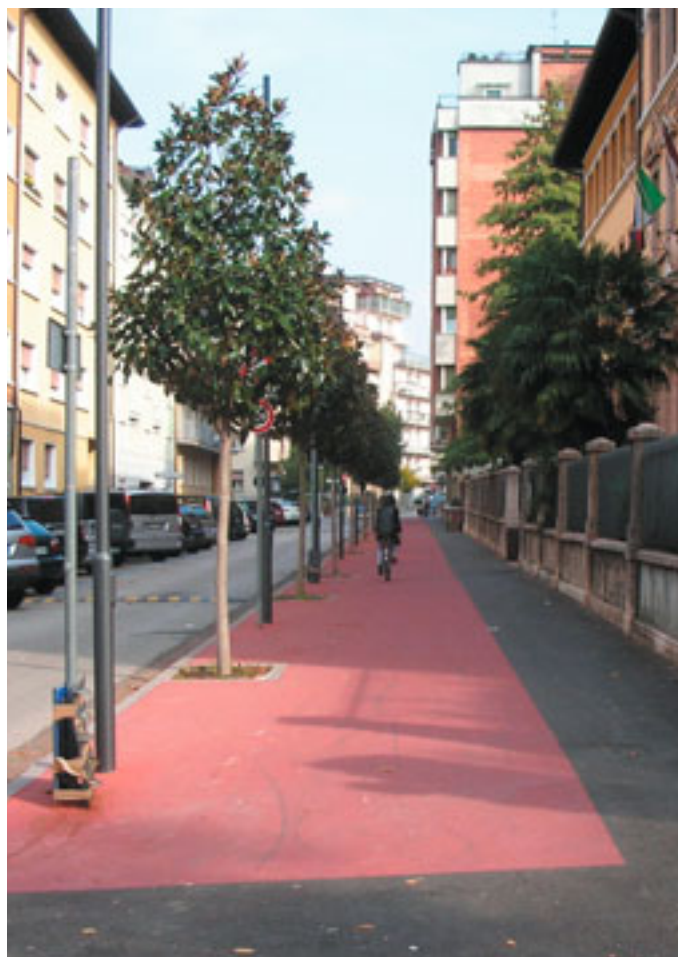
Nuova pista ciclabile via Malfatti - via a Prato.