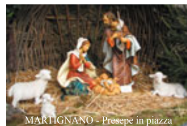
MARTIGNANO - Presepe in piazza