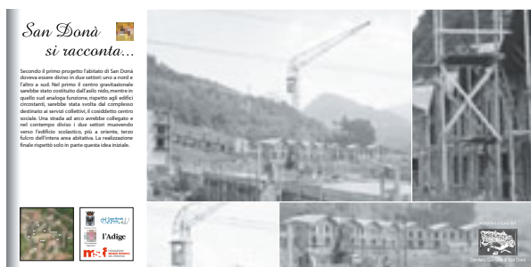
SAN DONA' - Pannello fotografico della mostra