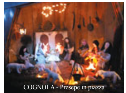
COGNOLA - Presepe in piazza

Giov. 24 VILLAMONTAGNA: All'uscita della Santa Messa della veglia natalizia, al di fuori della Chiesa ci saranno dolci e vin brulé per scambiarsi gli auguri in compagnia.