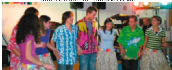
MONTEVACCINO - Arrivano i nostri!