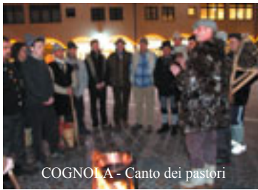
COGNOLA - Canto dei pastori

COGNOLA: Inaugurazione in piazza Argentario del mercato "Equosolidale" , resterà fino al 20 dicembre. Alle associazioni che ne faranno richiesta, verranno messe a disposizione gratuitamente a turni, 3 casette per raccogliere fondi a scopo umanitario, esibendo dei prodotti creati e/o confezionati dalle stesse associazioni. In alcuni momenti, verranno proposte esibizioni corali accompagnate da bevande e dolci natalizi.