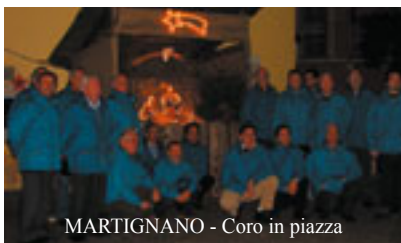
MARTIGNANO - Coro in piazza

Ven. 25 MONTEVACCINO: Il Coro "Monte Calisio": S.Messa + breve concerto di Natale, ad ore 9:45 presso la Chiesa di Montevaccino.