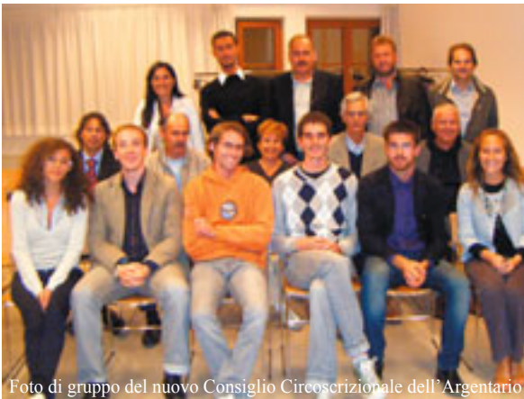
Foto di gruppo del nuovo Consiglio Circostrizionale dell'Argentario

Con questa breve rubrica vorremmo mantenere sempre viva l'informazione e la trasparenza sulle delibere, sulle votazioni e sui lavori del Consiglio Circostrizionale dell'Argentario in modo da creare e rafforzare i legami partecipativi della comunità con le istituzioni. Sappiamo che, solo sentendoci tutti corresponsabili della gestione del bene comune, i Consiglieri eletti ed il Consiglio Circostrizionale stesso potranno capire quali sono le vere esigenze ed aspirazioni della comunità dell'Argentario.