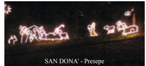
SAN DONA' - Presepe