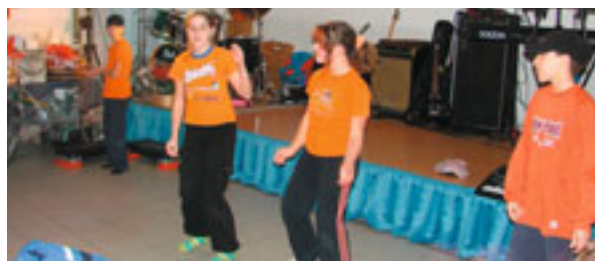
MONTEVACCINO - Arrivano i nostri!

SAN DONA': Ad ore 10.30 inaugurazione mostra "San Donà si racconta" : esposizione di pannelli fotografici che raccontano il villaggio di cinquant'anni fa. Organizzata: dal Comitato Quartiere di San Donà, in collaborazione con il Museo Storico di Trento, nell'ambito delle celebrazioni per il mezzo secolo di vita di San Donà.