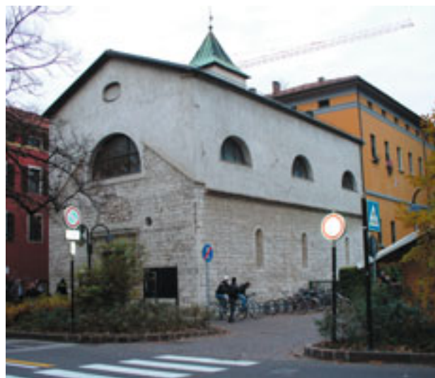
La chiesa di Santa Chiara in via Santa Croce

È un esempio di architettura romanica religiosa pur con alcuni interventi pesanti barocchi (1629). Le due fasi la medioevale e la seicentesca sono visibili sia all'esterno che all'interno, come nel campanile. Delle prime sono testimonianze i conci calcarei a vista, segno del timpano con oculi delle dimensioni laterali dell'edificio originario, le monofore oblunghe dei prospetti sud e nord giro inferiore e le bifore del campanile. La seconda fase la troviamo all'esterno nella sopraelevazione intonacata, nelle finestre a lunetta nel rosocino del timpano. L'antico monastero delle Clarisse è stato oggetto di numerose ricostruzioni e ristrutturazioni, è un autorevole edificio seicentesco che conserva un tratto di chiostro e dei loggiati. Oggi è centro dei servizi Culturali Santa Chiara.