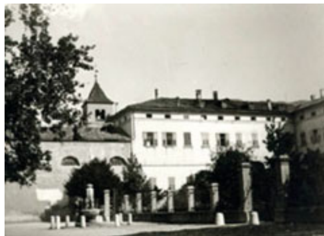
La chiesa di santa Chiara ed il convento

Ora sono lì inseriti il parco, l'Auditorium e un edificio occupato dalla facoltà di lettere.