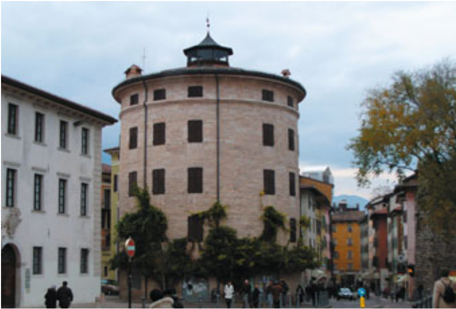
Il torrione in Piazza Fiera