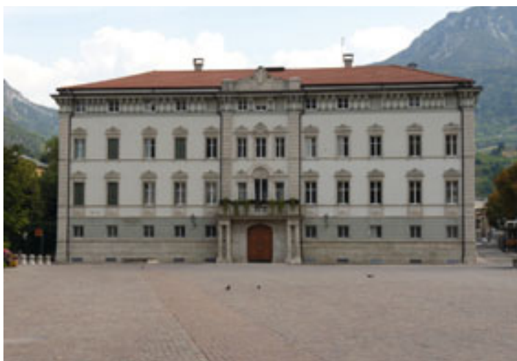
Il palazzo vescovile in Piazza Fiera

Piazza della Fiera costituisce il punto di raccordo fra la città e il borgo Santa Croce, tra il centro storico e la città moderna a nord del Torrente Fersina. Anticamente (1315) era detto il “foro della ghiaia fuori porta Santa Croce”. Si apriva sulla sponda sinistra del Fersina il cui corso, protetto da un potente argine di pietre squadrate, serviva da fossato alle mura della città. Nei primi anni del XVI secolo la piazza serviva da spazio mercantile. Era detta “foro banale” nel 1525 “foro boario ed equino” “Luogo dove si fa la fiera” “Piazza de la Fiera”. Due secoli fa fu talvolta usata per esecuzioni capitali.