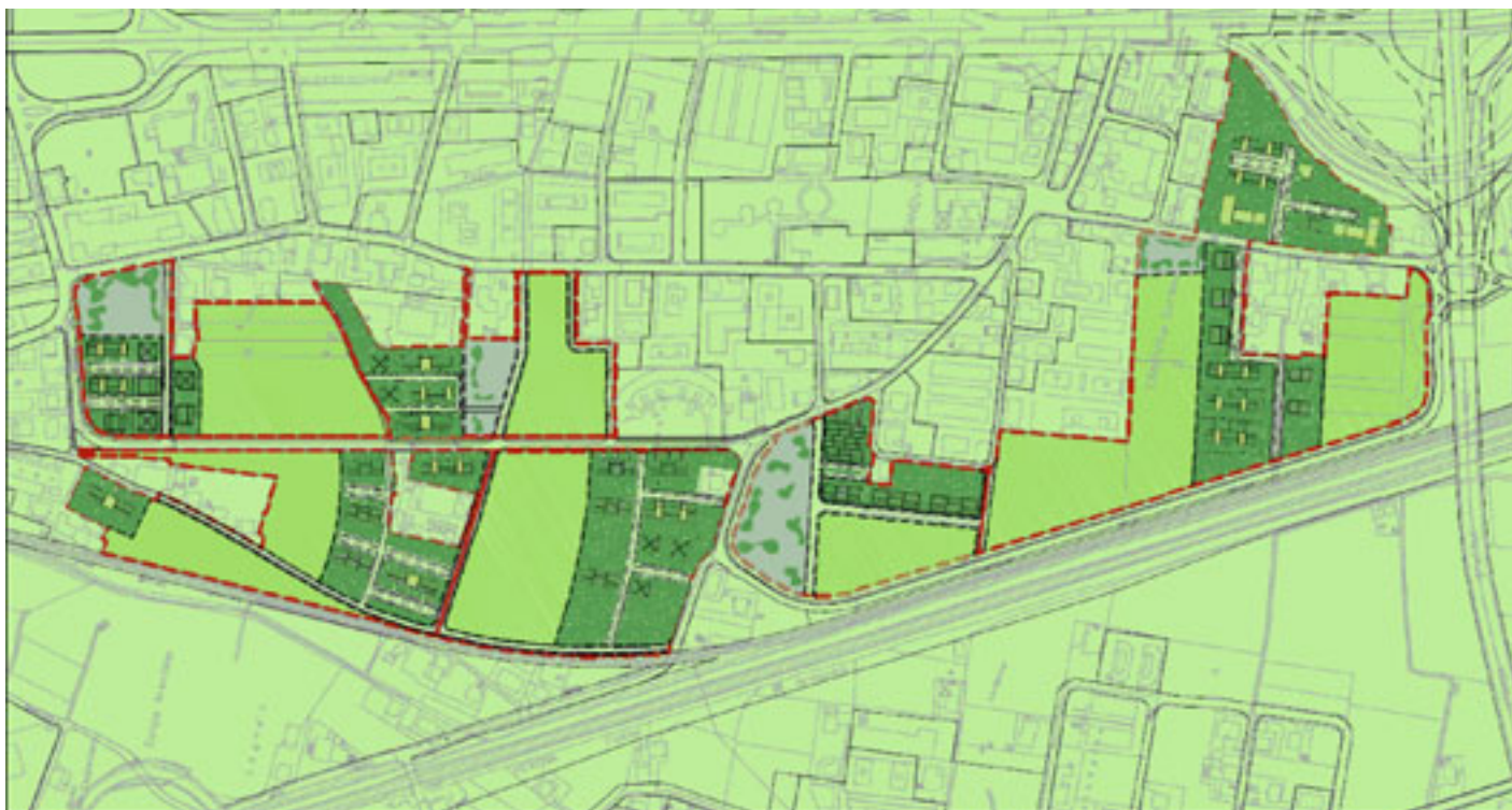
La zona C3 di Canova: la più grande area di espansione residenziale del Comune di Trento

Tra gli appuntamenti in agenda molto rilevante è il tema "casa" che oltre ad avere un impatto sull'ambiente, interesserà ancor più le relazioni sociali e la futura vivibilità del nostro territorio. Su questo punto sicuramente la Commissione, nel prossimo anno, sarà coinvolta nel valutare l'impatto, in termini urbanistici, che la realizzazione di nuove aree abitative, potrà comportare sul territorio della nostra Circoscrizione.