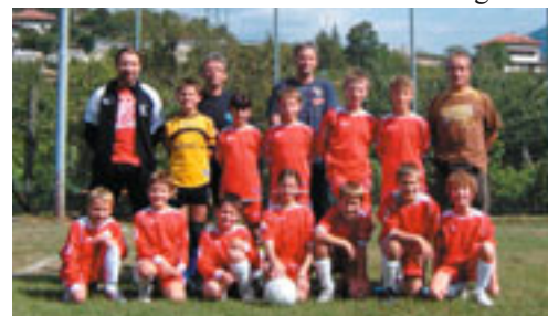
1 a Classificata: U.S. SARDAGNA

Un doveroso ringraziamento agli sponsor della manifestazione, la Circoscrizione di Sardegna e la Cassa Rurale di Sopramonte per il loro sostegno finanziario; alla Sportiva di Sardegna il giusto riconoscimento per la gentile collaborazione e la disponibilità messa in campo anche in questa occasione.