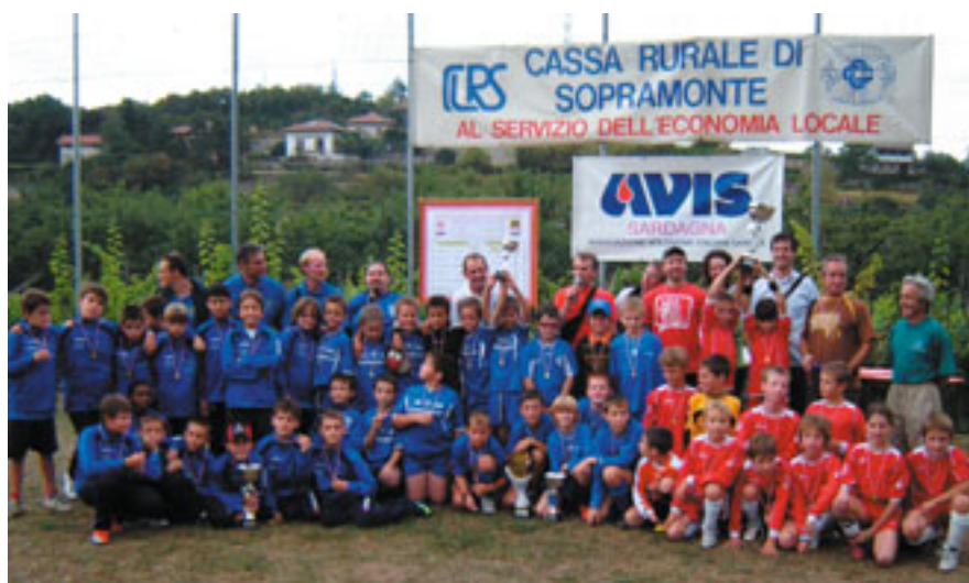
FOTO DI GRUPPO FINALE