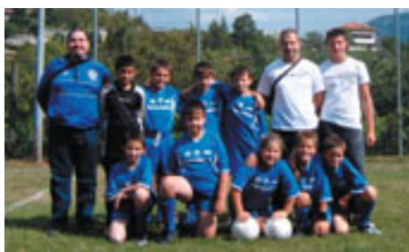
3 a Classificate: G. S. SOPRAMONTE