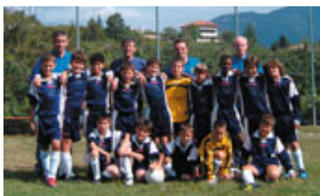
2 a Classificata: A.S.D. Stella Azzurra