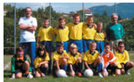
a pari merito con U.S. AZZURRA S.B.