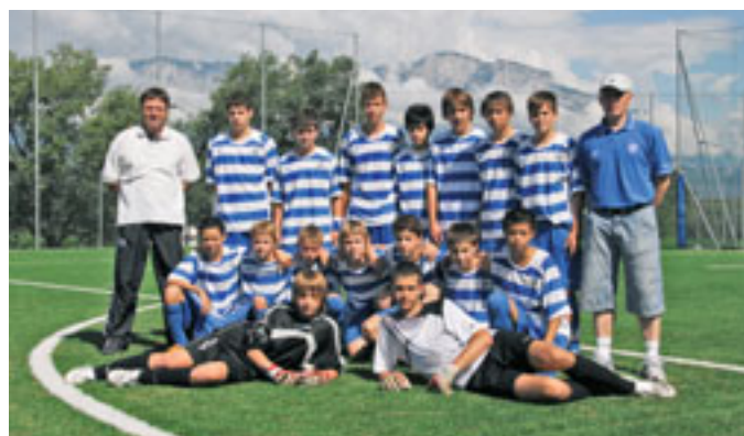
Znojmo (Repubblica Ceca)