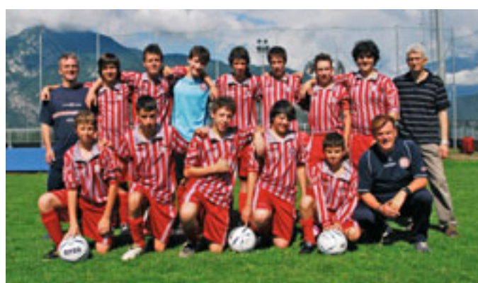
Monte Calisio (Italia)