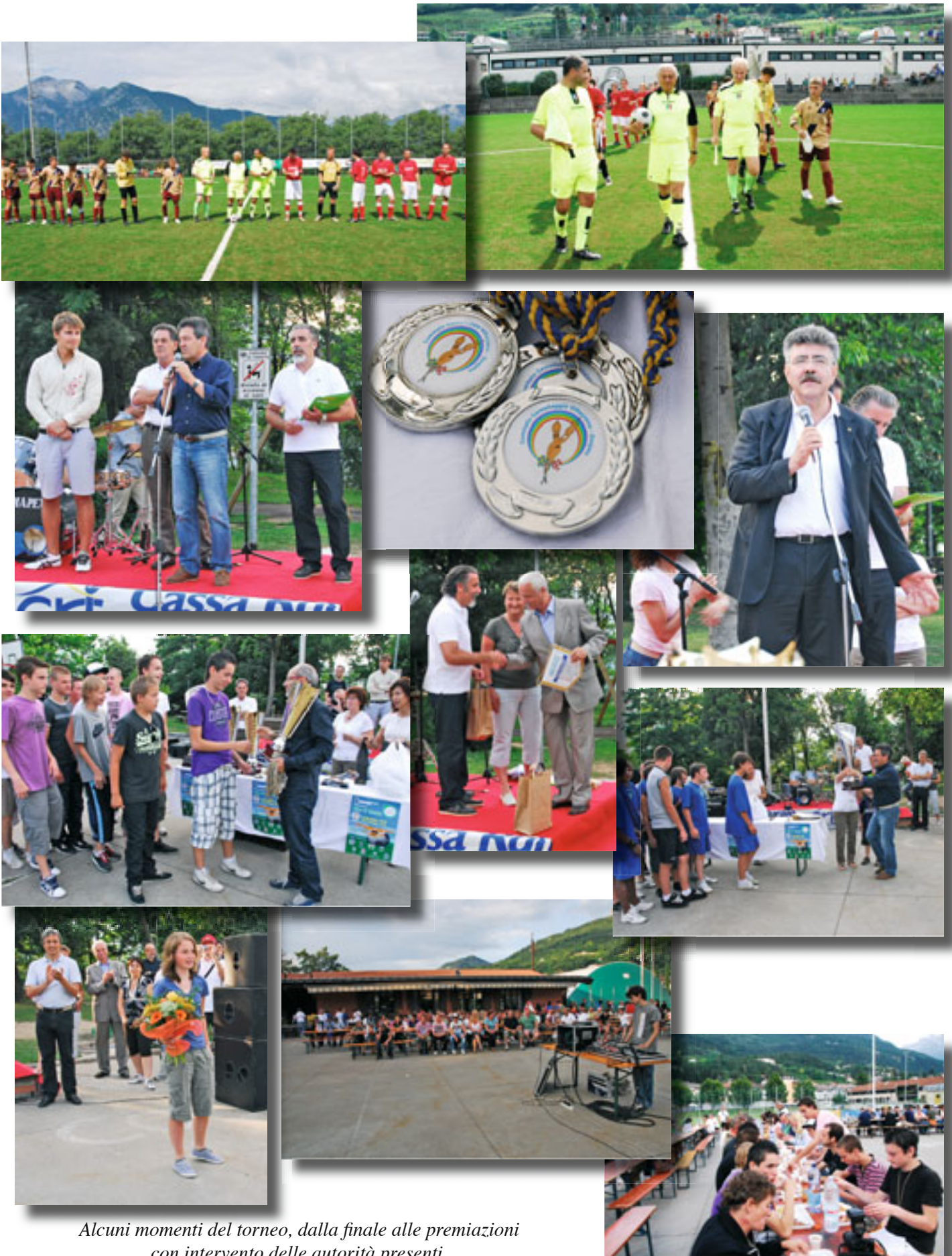
Alcuni momenti del torneo, dalla finale alle premiazioni con intervento delle autorità presenti.