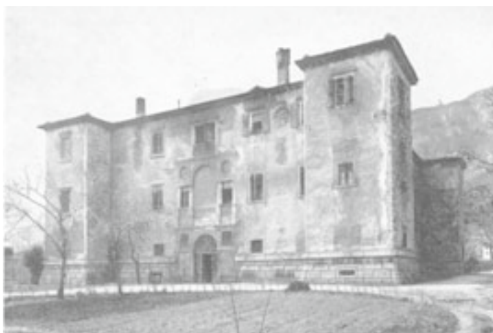
Il Palazzo delle Albere

Agli inizi degli anni Sessanta si poteva ancora raggiungere il Palazzo delle Albere da via Santa Croce, passando sotto gli archi bugnati dei Tre Portoni. Lo si intravedeva in fondo a via Madruzzo, ma a guidare lo sguardo non era più la prospettiva delle albere (pioppi), che avevano ombreggiato un tempo il viale cinquecentesco. La via era fiancheggiata da abitazioni e dal muro di cinta del Ginnasio Vescovile (Seminario Minore); superato poi l'incrocio con via Giusti, che rompeva la continuità del percorso, si passava tra il Cimitero Monumentale Vecchio (1827-1858) e quello Nuovo (iniziato nel 1889), collocati a nord e a sud dell'antico tracciato. Si raggiungeva così l'ingresso merlato del "Prato di Palazzo", tra due edifici che un tempo avevano ospitato il corpo di guardia e le stalle. Una seconda cesura ci attendeva, la ferrovia del Brennero, inaugurata nella primavera del 1859. Ed eccole finalmen-