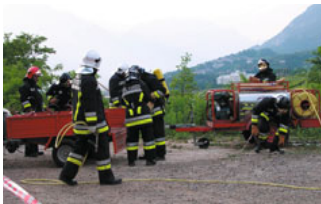
Manovra di spegnimento incendio boschivo