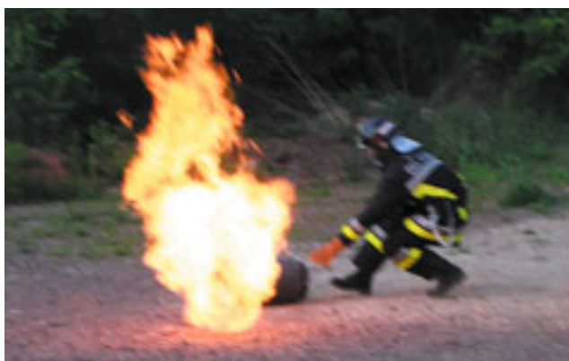
Esercitazione di spegnimento bombola

duramente l'Abruzzo il 6 aprile 2009: persone semplici che nel loro piccolo hanno, comunque, dato una mano insieme a migliaia di altri volontari provenienti da tutta Italia ad una popolazione afflitta da una tragedia di enormi proporzioni. Da non dimenticare anche la partecipazione del Corpo alla Festa di Santa Barbara il 4 dicembre 2009 ove sono sfilati tutti i Corpi delle frazioni di Trento per le vie del centro cittadino, ed in tale sede è stata anche consegnata dal Sindaco la bandiera di Trento ad ogni Corpo.