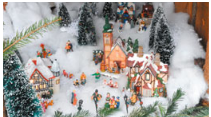
Immagini dei presepi che hanno partecipato al concorso