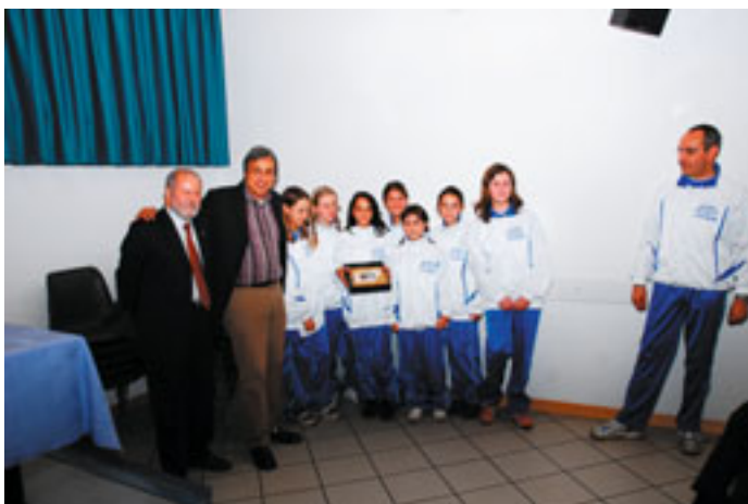
Under 13 pallavolo femminile