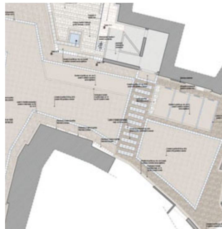
Particolare dell'entrata casa Sardagna e della piazza