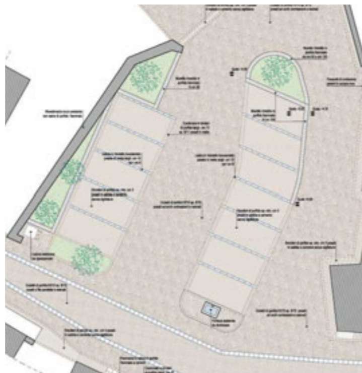
Particolare del parcheggio

Siamo inoltre consapevoli che esistono dei problemi legati ai parcheggi nel centro storico. Tuttavia, stiamo portando avanti l'ipotesi di creare una decina di posti auto lungo via Maria Pederzoli che sta trovando, con nostra soddisfazione, risposte concrete da parte dell'amministrazione comunale.