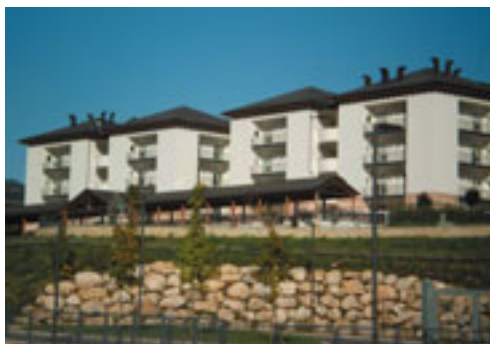
RSA San Bartolomeo

22 Maggio 2010: la cerimonia inaugurale della R.S.A. di S. Bartolomeo