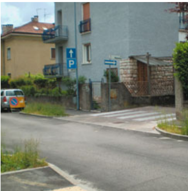
Via Nicolodi angolo via Ravenna