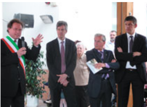
L'intervento del sindaco