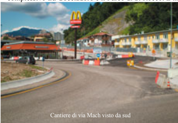
Cantiere di via Mach visto da sud