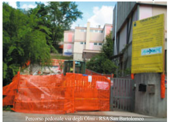
Percorso pedonale via degli Olmi - RSA San Bartolomeo