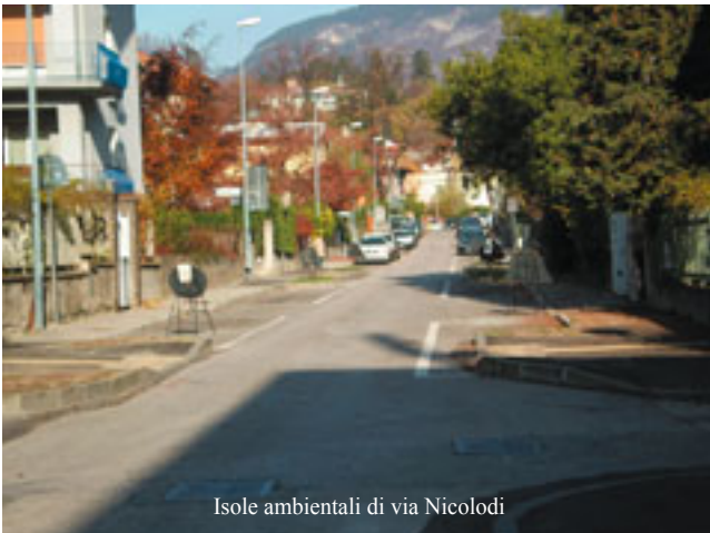
Isole ambientali di via Nicolodi

• Messa in sicurezza di parte dei percorsi pedonali e carrabili all'interno del Parco di Gocciadoro: iniziano e saranno ultimati entro l'anno i lavori di sistemazione dei percorsi danneggiati dai dissesti idrogeologici all'interno del parco e la realizzazione di una scogliera;