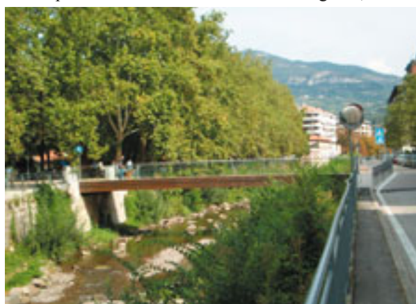
Ponte di via Marsala

Ho imparato a conoscere i nuovi Consiglieri, molto motivati come lo sono anche