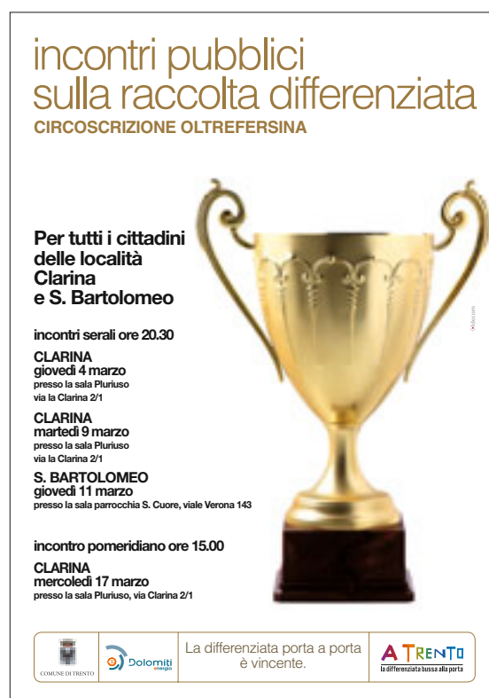
Locandina assemblee Porta a Porta