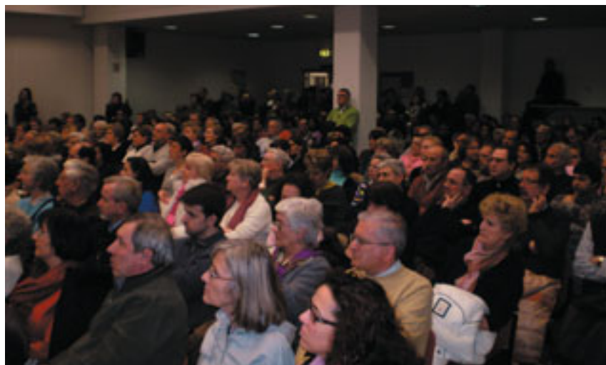
Una delle assemblee in Clarina

Perché il progetto possa essere attuato con efficacia è necessaria la condivisione e la collaborazione di tutti i cittadini.