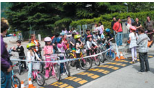
Piccoli ciclisti al Vieninbicinclarina

Circa 150 i bambini che dalle 10 di mattina si sono iscritti alla gimkana che si è svolta in Via Einaudi. Si andava dai 4 anni fino alla fine delle elementari e i partecipanti con la loro bici dovevano superare un piccolo percorso ad ostacoli. C'erano, infatti, dei coni di plastica che indicavano il tragitto da compiere. "Lo scopo di questi esercizi è quello di sviluppare la mobilità e l'attenzione ai pericoli che si possono trovare sulla strada" ha ribadito Giuliana Franceschini. In base alla fascia d'età sono stati poi premiati i più veloci. A tutti, comunque, sono stati consegnati degli opuscoli su come deve essere il comportamento del bravo pedone, ciclista e su come bisogna mettere i seggiolini e un piccolo gadget. Durante la