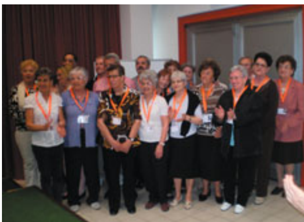
Volontari del Telefono d'Argento