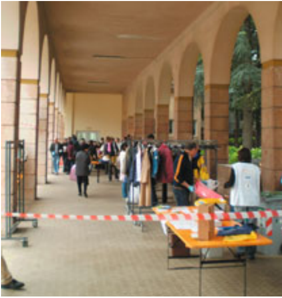
Giornata del Ri-uso

Una seconda vita agli oggetti che non ci servono più: tutto questo grazie alla giornata del riuso che si è svolta l'otto Maggio in Viale Verona 141, nel cortile interno dell'Istituto di formazione professionale. Svariati gli oggetti che si potevano trovare: i vestiti, soprattutto quelli da donna, erano quelli che la facevano da padrona, ma di certo non potevano mancare i giocattoli per i bambini. Basta, infatti, una piccola o grande macchinina, un nuovo gioco da tavola o puzzle a renderli felici senza spendere neanche un euro.