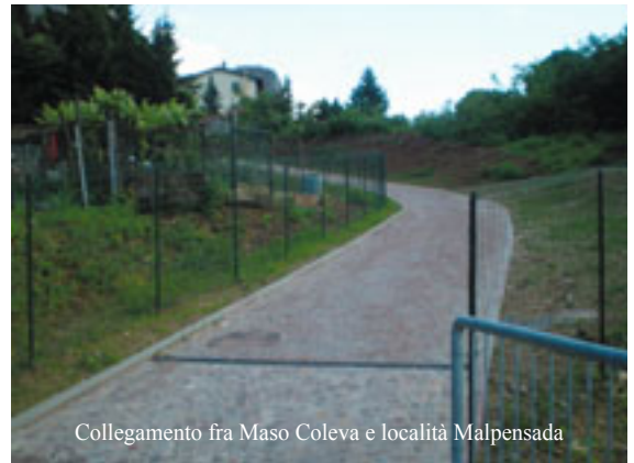
Collegamento fra Maso Coleva e località Malpensada