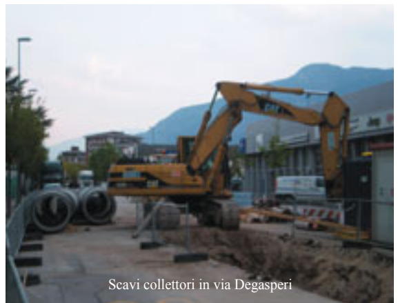
Scavi collettori in via Degasperri