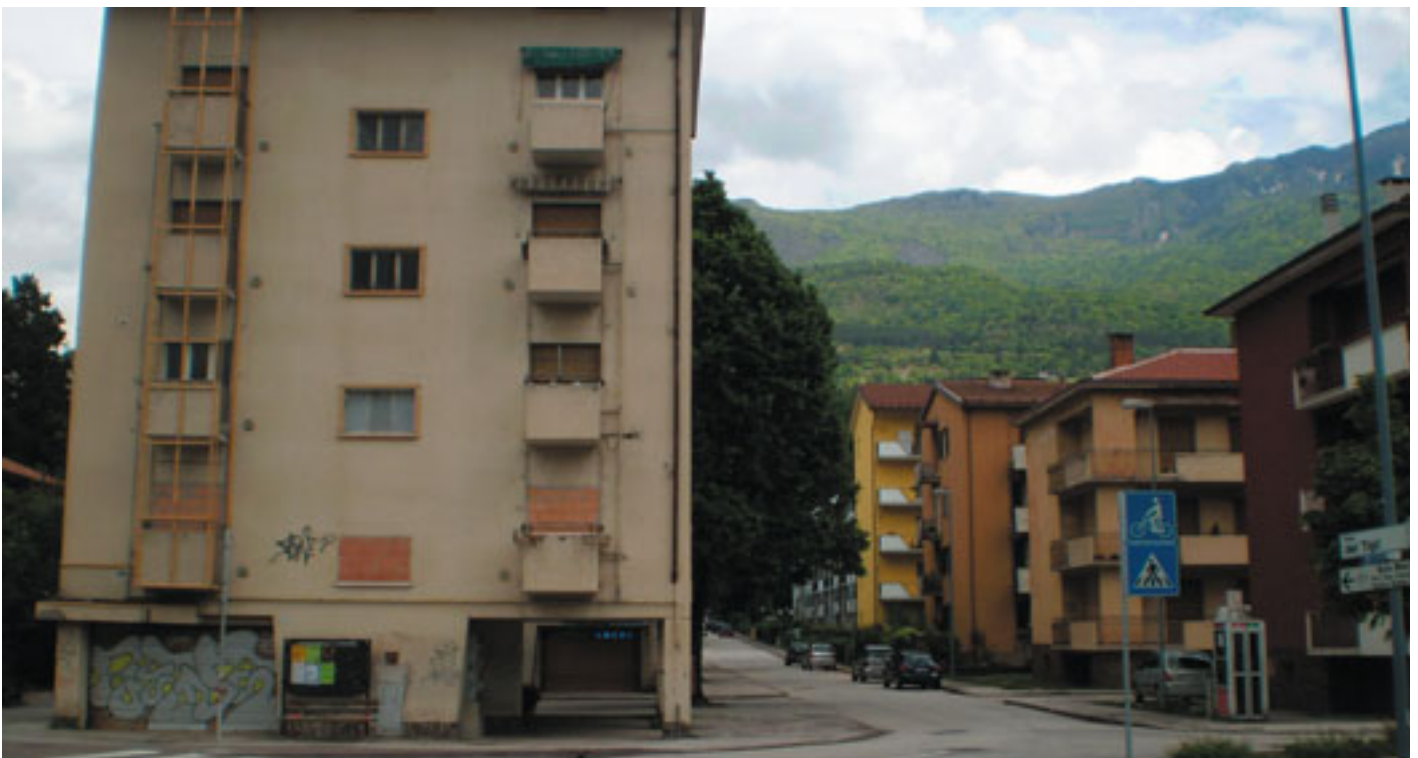
Palafitta via dei Tigli