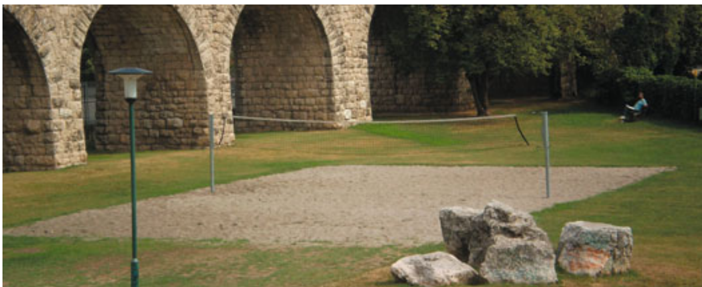
Campo di beach volley