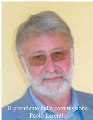
Il presidente della commissione Paolo Larentis

Terminata la fase dell'individuazione dei temi da trattare e di una prima progettazione di massima, la Commissione ha iniziato ad entrare in una fase più operativa.