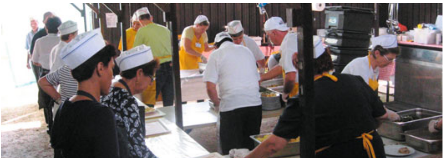
I volontari della Festa Oltrefersina

L'indirizzo del Comitato Associazioni Oltrefersina è: Via la Clarina n. 2/1 e-mail info@comitatoassociazionioltrefersina.it sito www.comitatoassociazionioltrefersina.it