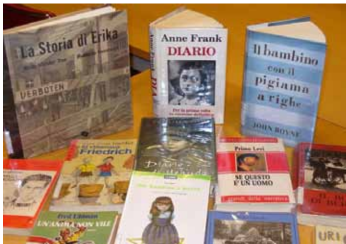
La mostra bibliografica sulla Shoah in occasione della Giornata della Memoria

Si è concluso un altro semestre ricco di soddisfazioni per la nostra sede periferica. Mostre bibliografiche, incontri con narratori, vetrine tematiche e visite periodiche delle scolaresche hanno vivacizzato questa prima parte dell'anno. Si sta rinnovando il patrimonio bibliografico e potenziando pure quello relativo alla zona Argentario, mentre grazie alla collaborazione di alcuni volontari e tirocinanti si sta ordinando il fondo di documentazione locale. E' stato istituito, inoltre, un "bookcrossing point" per lo scambio e prelievo gratuito di libri donati dagli utenti. Si tratta di una felice esperienza, ormai nota a livello mondiale, che risulta gradita anche ai nostri utenti che in tal modo hanno l'opportunità di disfarsi di qualche libro, dando la possibilità a quest'ultimo di acquisire un nuovo proprietario.