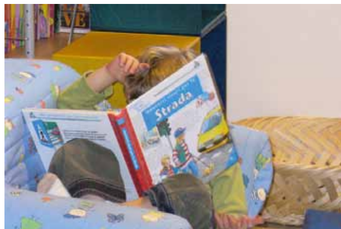
Meglio che a casa ..... nell'angolo morbido leggere e guardare le figure per i più piccoli è certamente rilassante

Non vi sarà alcun periodo di chiusura estiva.