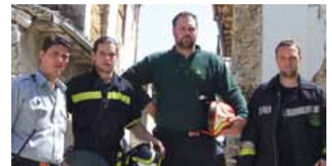
È rimasto in noi il segno indelebile della solidarietà, che non ha prezzo e che è tesoro di vita di tutti noi Volontari

hanno lasciato un'impronta profonda in questi luoghi, impronta che rimarrà nel cuore di ognuno. Non saremo mai dimenticati e noi mai li dimenticheremo.