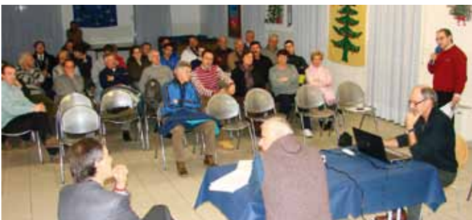
Molti cittadini all'incontro pubblico sulla toponomastica a Montevaccino 18-11

Ultimissime! La Commissione provinciale, in data 14 giugno, ha espresso parere favorevole alle ipotesi formulate dalla Circoscrizione e dal Comune. Non riconosce però il termine "Kalisberg" perché ha solo valore storico. Chiede inoltre di dare una denominazione alternativa al tratto interno all'abitato, proponendo "Via al Mont de sora". La questione verrà dunque ripresa a breve all'interno della Comunità e della Circoscrizione.