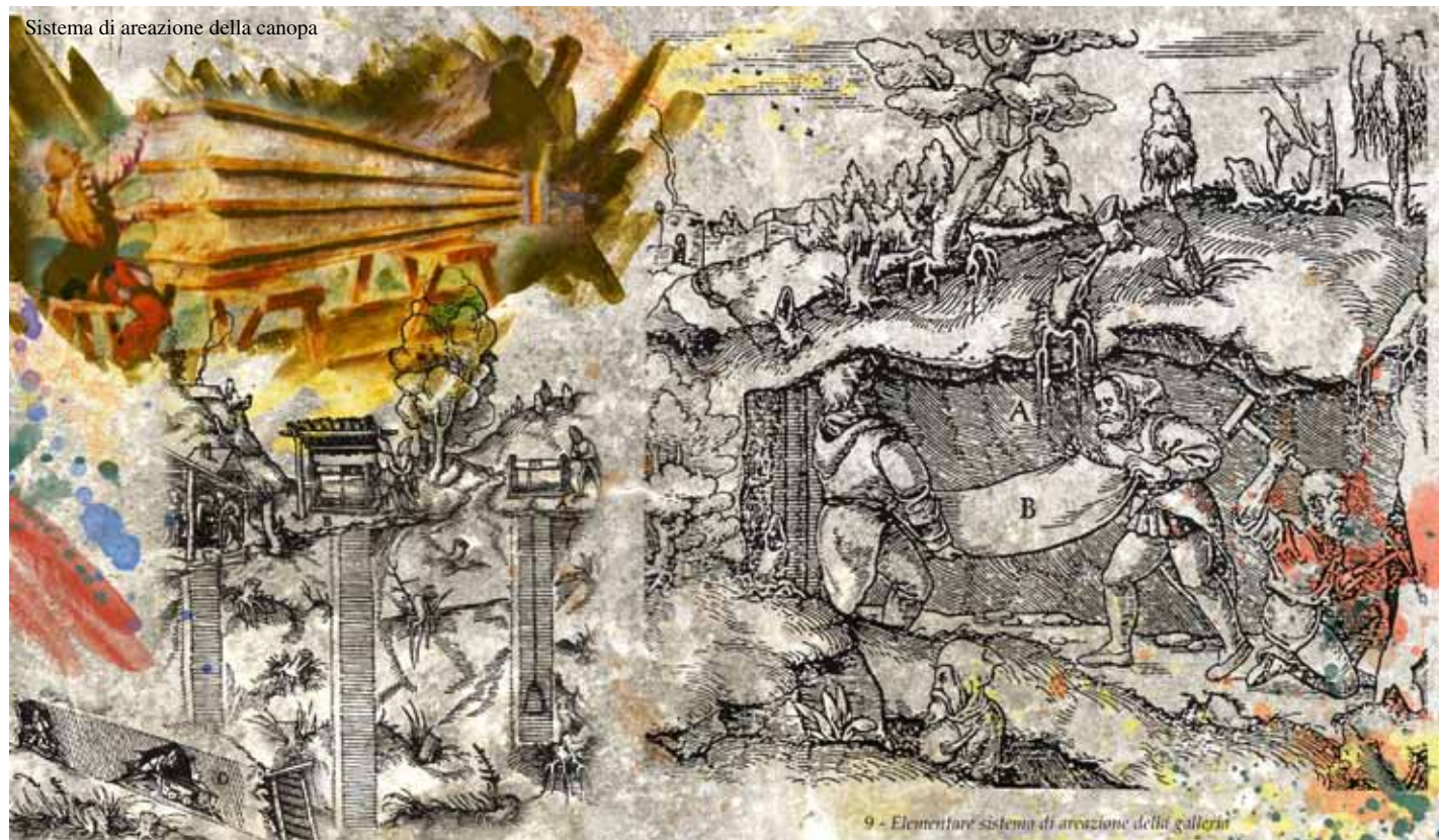
9 - Elementare sistema di areazione della galleria