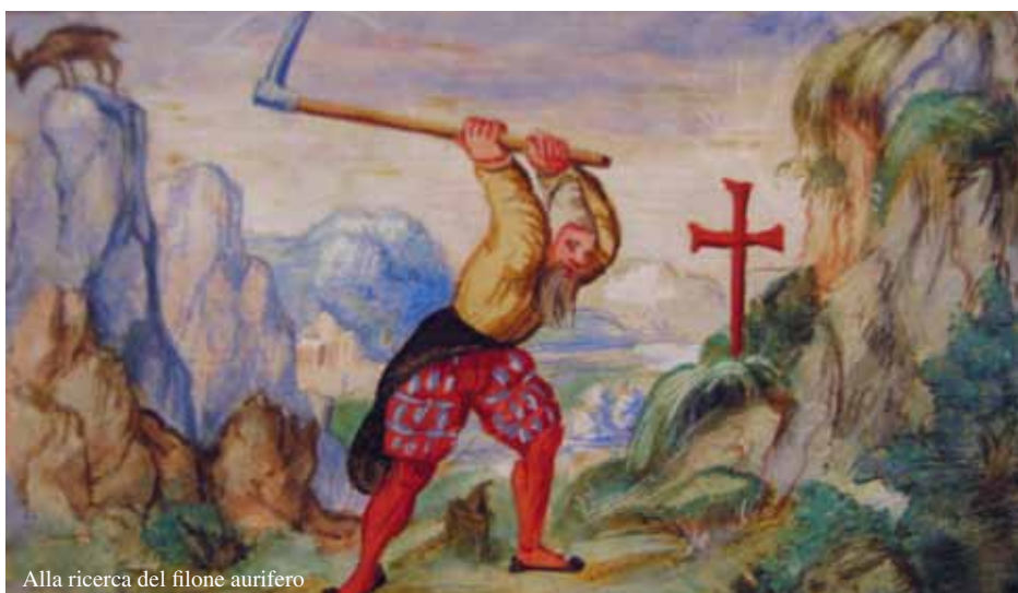
Alla ricerca del filone aurifero

Se hai voglia di raccogliere questa sfida e hai un'età compresa tra i 16 e i 29 anni, ci sono alcuni muri disponibili. Qualsiasi tecnica è ben accetta (bombolette, colo-