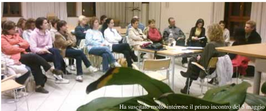
Ha suscitato molto interesse il primo incontro del 5 maggio

La forma primaria più efficace di prevenzione dell'abuso consiste primariamente nell'attivare nella formazione dei genitori e degli educatori, al fine di risvegliare un'attenzione più ampia e profonda verso il bambino/a e il/la preadolescente, verso il loro mondo interiore e quello delle relazioni; che porti a migliorare la qualità dei rapporti famigliari, della comunicazione, del gioco, dell'ascolto, del dialogo. Solo una relazione intensa ed equilibrata potrà permettere di vedere, di interpretare correttamente i segnali, di trovare il coraggio di approfondire i tanti aspetti di felicità e di disagio che caratterizzano la vita interiore nell'età evolutiva.