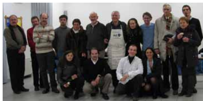
La formazione del Consiglio dell'Argentario quasi al completo a Montevaccino 1-2-2010

Anche a Montevaccino, il Consiglio Circoscrizionale ha trovato una comunità molto organizzata, che nella sala del centro sociale ha illustrato tramite una presentazione con slides le priorità della comunità: realizzazione dell'area ricreativa e sportiva, la messa in sicurezza della strada di accesso al monte di sotto, realizzazione del marciapiede da località Librar alla chiesa, potenziamento delle linee telefoniche, monitoraggio idrogeologico di Val Larghe, Prabona e Loch, corsa autobus per la scuola primaria verso Martignano, alcuni lavori di intervento e ristrutturazione del centro sociale (installazione cucina, lavori per l'ambulatorio, sanificazione pareti, pc per punto prestito, ecc.), messa in sicurezza dell'incrocio presso il centro sociale, messa in sicurezza della strada provinciale, ripristino dello stradino per la pulizia delle strade, gestione del rifugio Monte Calisio, ridefinizione dei confini anagrafici in località Librar tra Gardolo di mezzo e Montevaccino ed altri più piccoli interventi di manutenzione e pulizia.