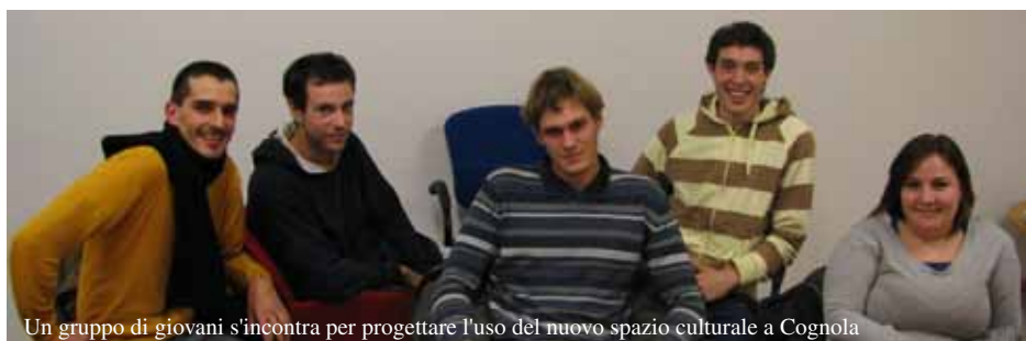
Un gruppo di giovani s'incontra per progettare l'uso del nuovo spazio culturale a Cognola