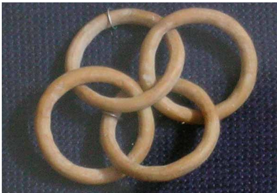
I quattro anelli di marmo. Ogni anello ha il diametro di tre centimetri, lo spessore è di mezzo centimetro. La figlia li custodisce in uno scrigno-portagioie.