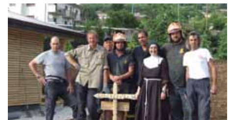
Una casetta di legno è stato il segno tangibile che la comunità dell'Argentario ha donato alle suore tramite i Vigili

Il Corpo di Cognola ha operato in Abruzzo per 1128 ore di lavoro così suddivise: 5 vigili dal 6 all'8 aprile per 360 h 2 vigili dal 16 al 23 maggio per 384 h 1 vigile dal 13 al 20 giugno per 192 h 1 vigile dall'11 al 18 luglio per 192 h.