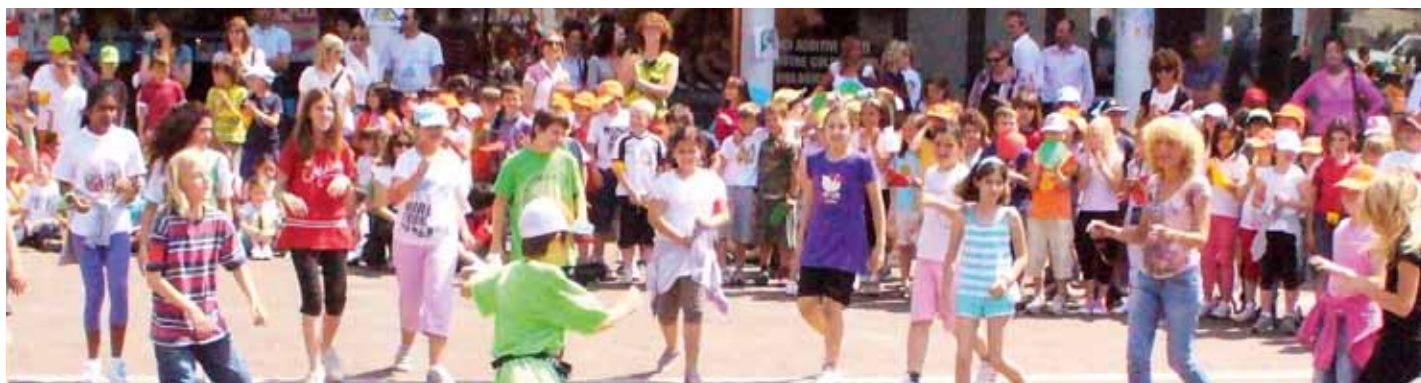
I Bambini Cittadini Attivi gremiscono la piazza di Cognola il 26 maggio 2010

Nella mattinata di mercoledì 26 maggio 2010 tutti i 280 alunni della scuola primaria Bernardi di Cognola insieme ai loro insegnanti hanno dato vita ad un evento a conclusione del percorso “Bambini cittadini attivi” proposto dal Comune di Trento.