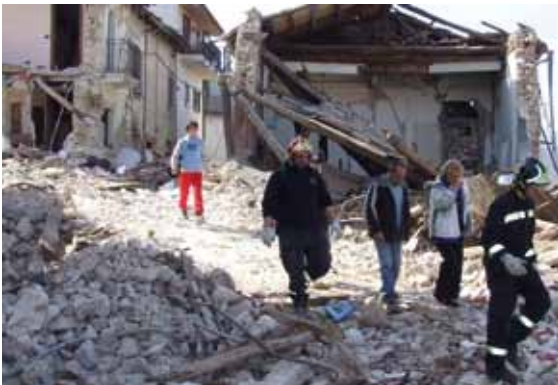
Il cambio dei colleghi che tornano dalle macerie

Alle 12 partiamo con la Jeep ed il Ducato: siamo in cinque vigili del Corpo di Cognola. Dopo un viaggio reso interminabile dalla voglia di arrivare per dare una mano, siamo giunti a Paganica nella notte; paese vicino L'Aquila, indicatoci dalla Protezione Civile come campo base. Assieme a noi, una marea di mezzi di soccorso arrivati da tutta Italia. Alle 23, divisi in squadre, seppur stanchi e provati, iniziamo ad allestire le tende che ospiteranno i soccorritori per le poche ore di sonno prima di ritornare a scavare; successivamente diamo il cambio ai colleghi tornati dalle macerie.