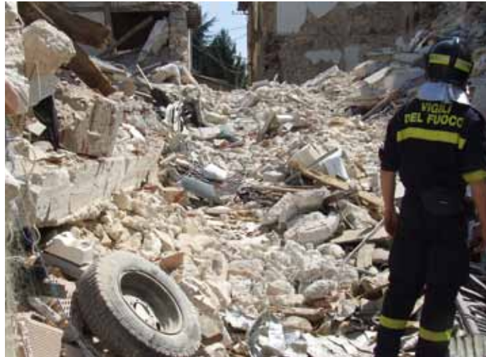
S. Gregorio è un cumulo di sassi, dove il terremoto ha portato via otto persone

Ancora nel cuore della notte ci portiamo a S. Gregorio, una frazione medievale a pochi chilometri da Paganica. La scena è apocalittica ed in un solo istante ci rendiamo conto della potenza della Terra: una scossa e l'uomo scompare con tutto quello che credeva costruito per sempre. Qui, con le nostre mani o al massimo una pala, andiamo a scavare; oltre al resto, è crollata la "casa famiglia" gestita dalle suore, e sotto quelle macerie cerchiamo inutilmente qualcuno ancora in vita.