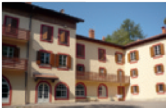
La Colonia di Pralungo

Si tratta di una mostra fotografica e documentale relativa a questa importante struttura di ospitalità che ha superato ormai gli 80 anni di vita. Una rassegna di notizie e ripro-