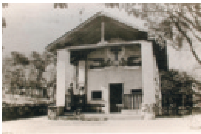
Nella foto sopra, la chiesetta nel passato, a fianco, la chiesetta ai giorni nostri

Dedicata a S. Anna (che si festeggia il 27 luglio), madre di Maria Vergine, patrona delle madri, delle vedove, delle partorienti ed invocata nei parti difficili e contro la sterilità coniugale