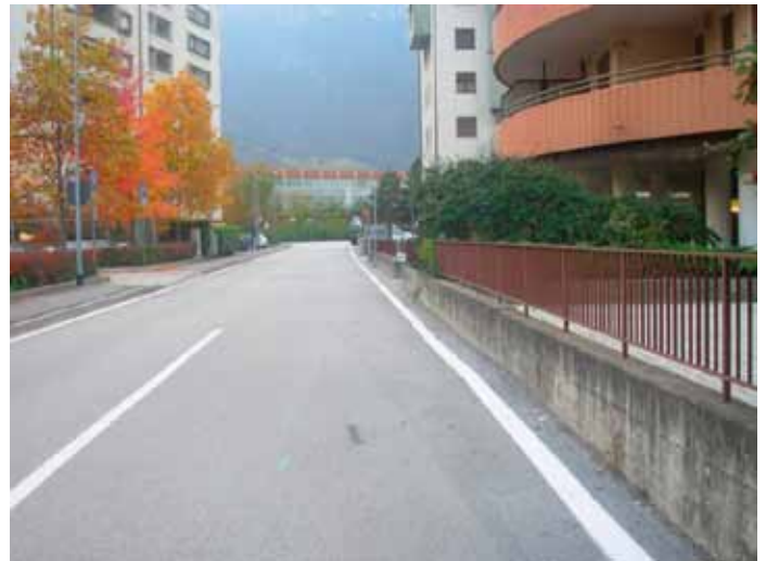
Via Bruno de Finetti