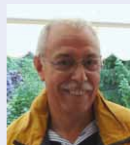
Dainese Giordano PD