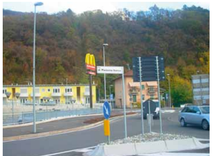
Via di Madonna Bianca