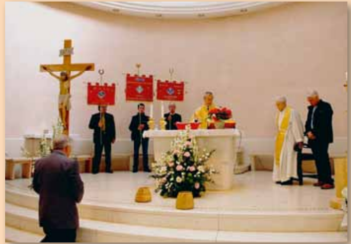
Santa Messa in occasione del 35° di fondazione.