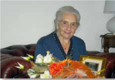
La centenaria nel giorno del suo compleanno.

Un particolare che ci ha colpito è stato quello di aver avuto ospite nell'albergo la principessa Margaret d'Inghilterra, che era particolarmente mattiniera e proprio a lei toccava il compito di alzarsi presto per preparare la colazione, in quanto a quell'ora il personale dormiva ancora.