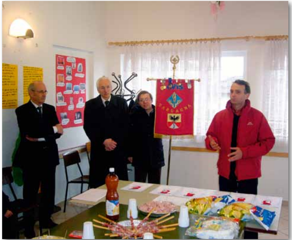
"Festa del donatore" – 28 febbraio 2010 Distribuzione degli attestati e delle benemerenze ai Soci

tivo dallo statuto, rientrano l'informazione e la raccolta di nuovi iscritti socio-donatori: rinnoviamo l'invito alle ragazze ed ai ragazzi che abbiano compiuto i diciott'anni di iscriversi all'Avis: donare il proprio sangue, oltre ad essere un gesto di alto valore etico e morale, rappresenta un modo concreto di essere vicini al nostro prossimo bisognoso.