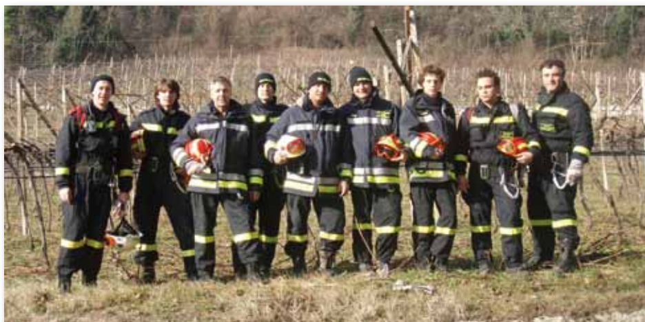
I vigili del Fuoco di Sardegna

zione e non solo? Il corpo dei Vigili del Fuoco Volontari! Sempre disponibili a dedicare parte del loro tempo a garantire la sicurezza a tutti noi in ogni periodo dell'anno. E ancora, l'Associazione Aquilone, il Circolo Pensionati ed Anziani, gli Autem, l'Avis, il Gruppo Sci Club Monte Bondone: tutti sempre disposti a "dar na man" oppure impegnati ad organizzare importanti e numerosi momenti dedicati a tutti noi: per vivere meglio e per distrarre un po' la mente dal lavoro e dai problemi quotidiani.