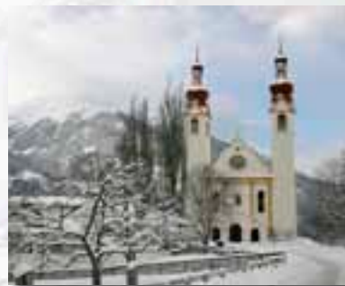
Chiesa di Santa Barbara

(traduzione curata dal Gruppo Amici di Fliess. Il testo originale è pubblicato sul sito www.amicidifliess.it )