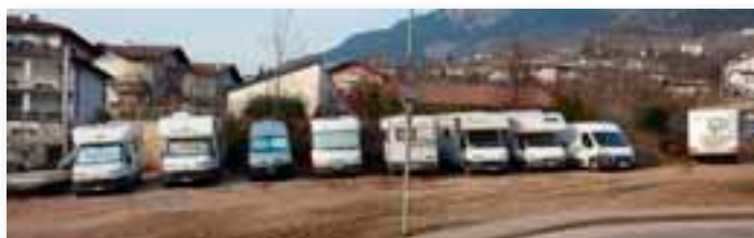
Cognola - Sarà presto sistemata l'area sterrata dietro il Centro Civico

talli sporgenti della struttura. Oppure, nei pressi della strada imperiale che porta a Civezzano, ci è stato segnalato che una panchina è stata divelta e rovesciata nella scarpata. Di questi, come altri piccoli lavori di manutenzione si farà carico nei prossimi mesi il Comune, che provvederà alla sistemazione per un miglioramento del decoro di tutto il territorio della Circoscrizione. Si fa appello a tutti i cittadini di segnalare in circoscrizione eventuali zone degradate.