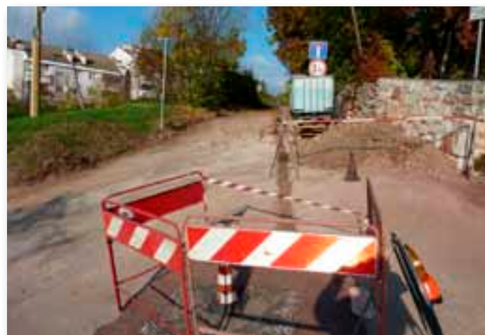
Cognola - Operazioni di cablaggio delle fibre ottiche