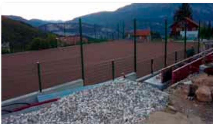
Montevaccino - Ormai avanzatissimi i lavori del nuovo campo sportivo