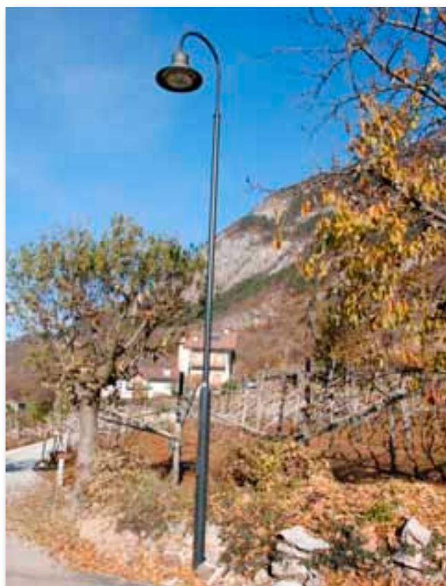
Via Sabbionare - nuovo impianto di illuminazione lungo tutta la via