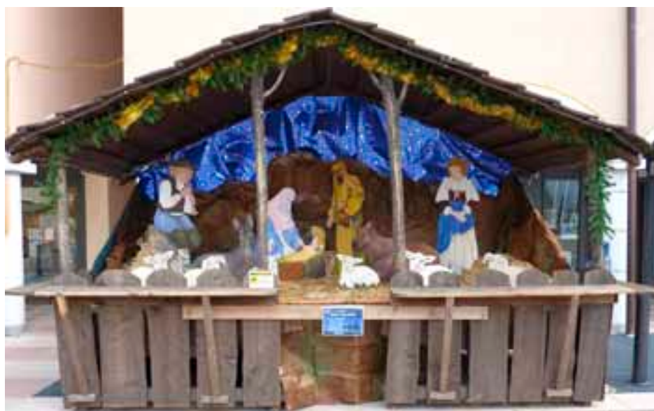
Presepe in piazza Argentario

L'avvicinarsi del Natale ci riporta ai temi religiosi, alle sensazioni di serenità ed alle tradizioni del nostro territorio.