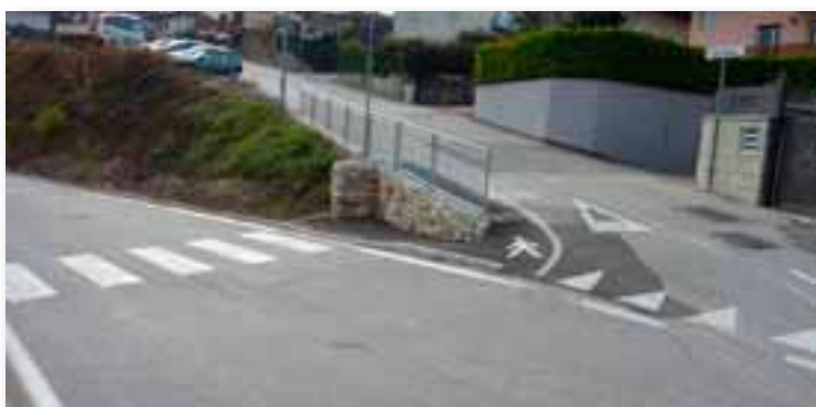
Messa in sicurezza del passaggio pedonale in via del Forte a Martignano