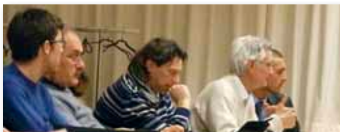
Consiglieri di minoranza