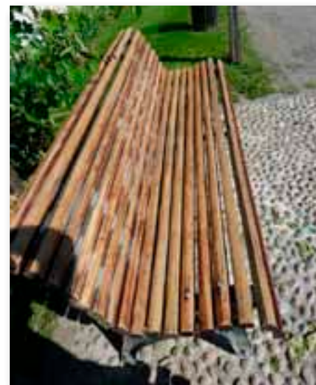
Parco di Martignano - Sono state sistemate 11 panchine dissestate