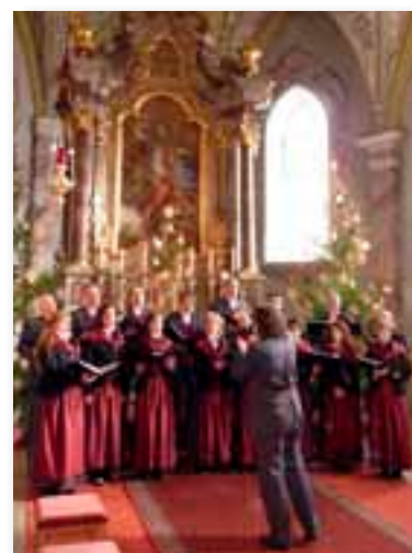
Musici Cantori nella chiesa di S. Martin a Schwaz

Molto apprezzati i cantori trentini. Creano entusiasmo e lasciano un buon ricordo.