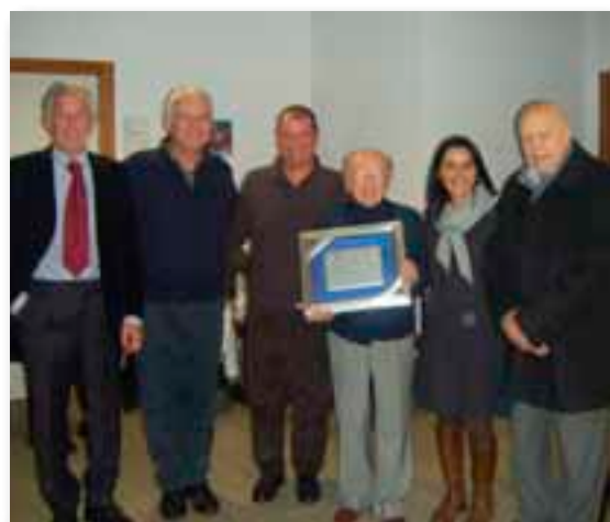
consegna della targa a Telefono d'Argento