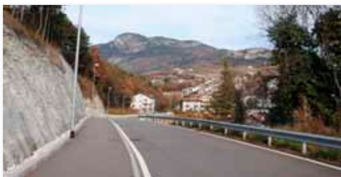
Via alla Pelegrina - installati anche i lampioni