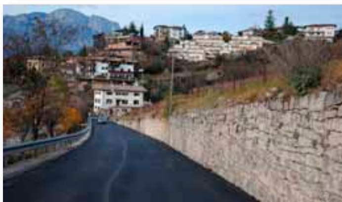
Via alle Coste - nuovo manto stardale