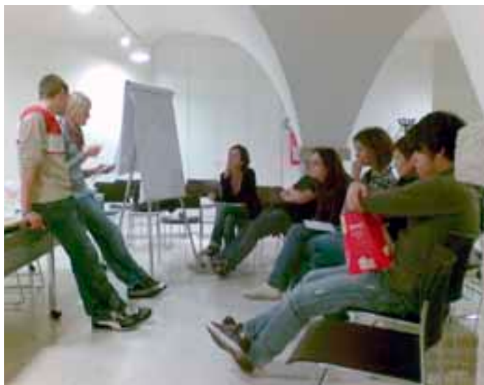
Prospetto da sud-est e pianta piano terra - progetto preliminare nuova scuola media

2. Si intende riproporre, in collaborazione con l'Azienda Provinciale per i Servizi Sanitari, l'Istituto Comprensivo Trento 7 e la pari Commissione della Circoscrizione di Meano, il percorso formativo di peer education (educazione alla pari) realizzato a Gardolo nei 2 anni 2010-2011. L'intento è quello di formare un nuovo gruppo di "educatori" al fine di progettare e realizzare azioni di promozione della salute e prevenzione del consumo di alcol rivolte a loro coetanei e ragazzi delle classi terze della scuola Pedrolli. Si cercano volontari di età compresa tra i 16 e 19 anni (6-10 ragazzi/e circa) che frequentino un corso della durata di 18 ore e organizzato appositamente presso le sale della circoscrizione nel mese di settembre 2012.