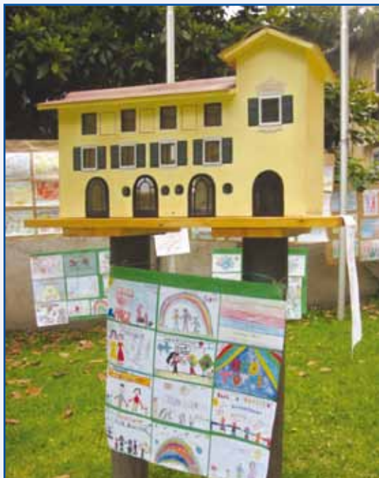
La LittleLibrary di Gardolo

del libro, per invogliare alla lettura. La "casetta" consente inoltre di utilizzare l'apposito contenitore, segnalato con le frecce, per lasciare eventuali suggerimenti e idee.