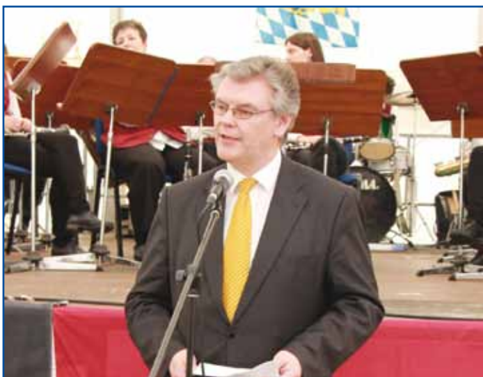
Reiner Schneider – Primo Sindaco del Comune di Neufahrn