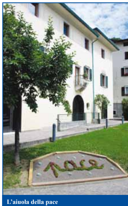
L'aiuola della pace