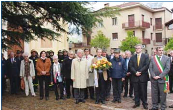
La domenica mattina, dopo la S. Messa, un momento di raccoglimento davanti al monumento ai caduti