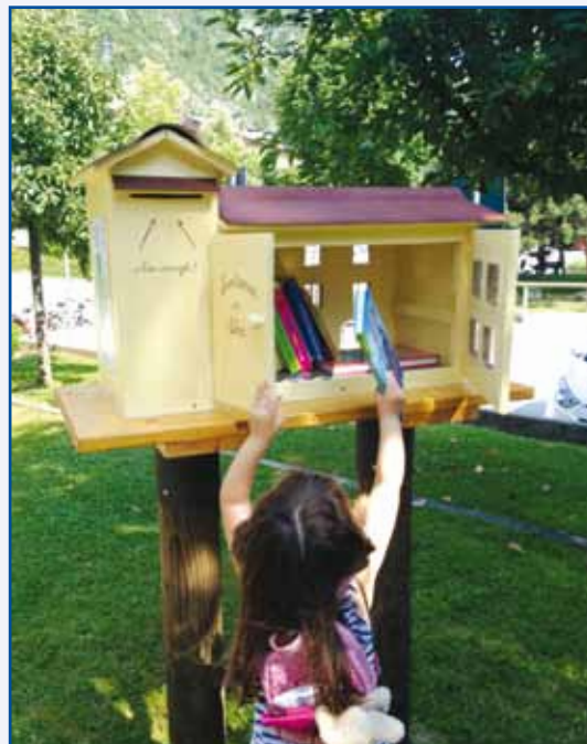
Prendi un libro, lascia un libro

In questo giornalino abbiamo dedicato diverse pagine ad iniziative che vedono la Circoscrizione come soggetto ideatore, promotore, coordinatore, ecc. ma, cosa molto più importante, vedono anche diversi altri soggetti come collaboratori, realizzatori, ecc.. Non avrebbe senso se la Circoscrizione proponesse attività chiuse in sé stesse, autoreferenziali. La forza sta nel contagio. Nel saper coinvolgere e nel far diventare protagonisti soggetti "esterni", espressione della comunità e del territorio. In questo modo i messaggi che si intendono comunicare e veicolare attraverso i progetti arrivano direttamente, in qualche caso nascono, tra e con la gente. E il grande sforzo, che è anche un atteggiamento di umiltà e di consapevolezza del ruolo, è quello di riuscire – al di là delle persone impegnate oggi in incarichi di responsabilità – a rendere autonome e continuative queste attività.