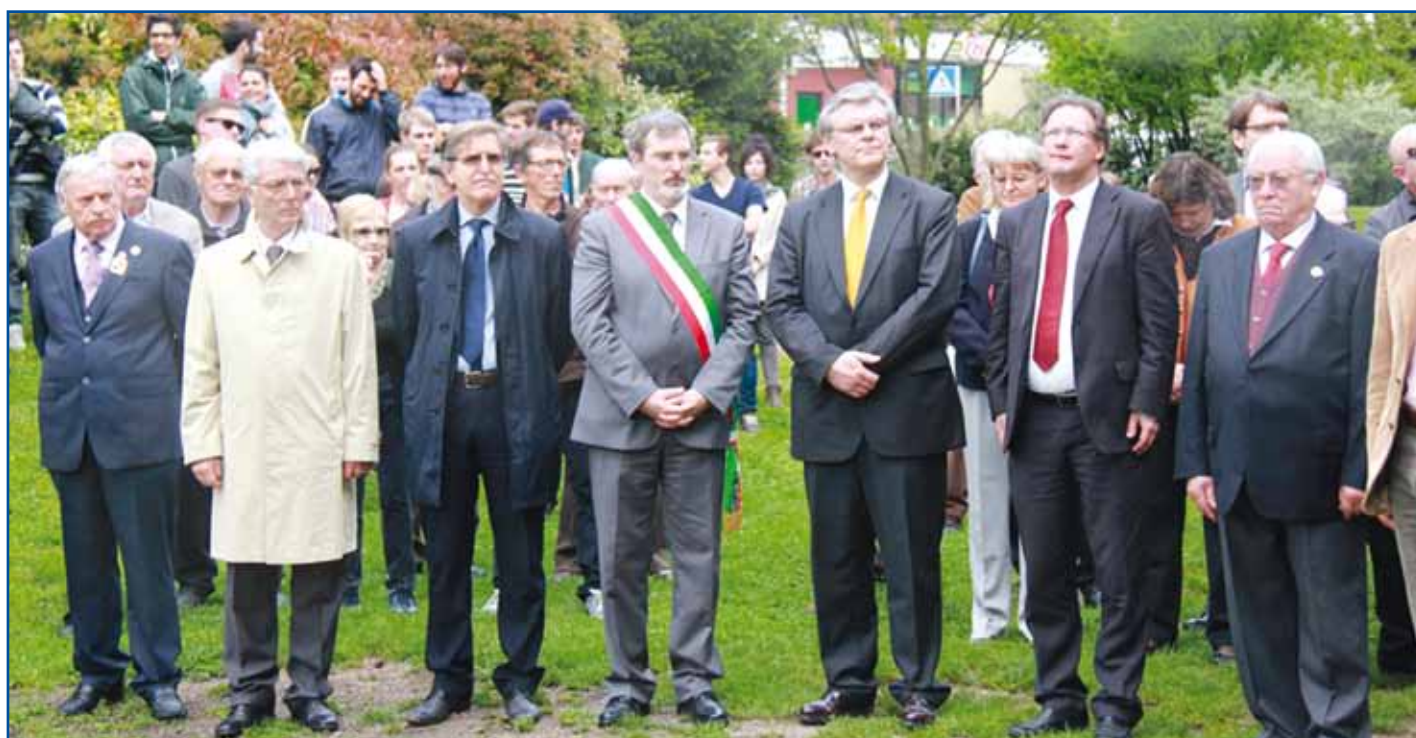
Sotto l'albero di maggio, durante l'esecuzione degli inni

In Baviera, ogni anno in primavera, viene sostituito il tronco tipicamente colorato di bianco e azzurro per salutare l'arrivo della nuova stagione. Stagione che porta con sé la semina, la rinascita e piantare l'albero rappresenta una sorta di rito della fertilità. Inoltre sul tronco vengono fissati gli stemmi delle professioni che caratterizzano l'economia di quel singolo paese.