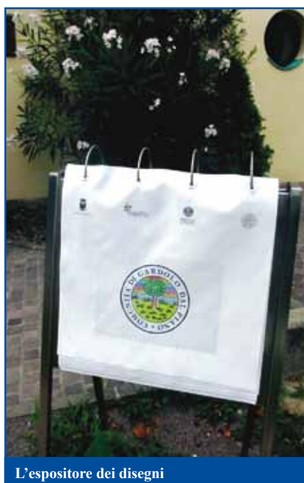
L'espositore dei disegni