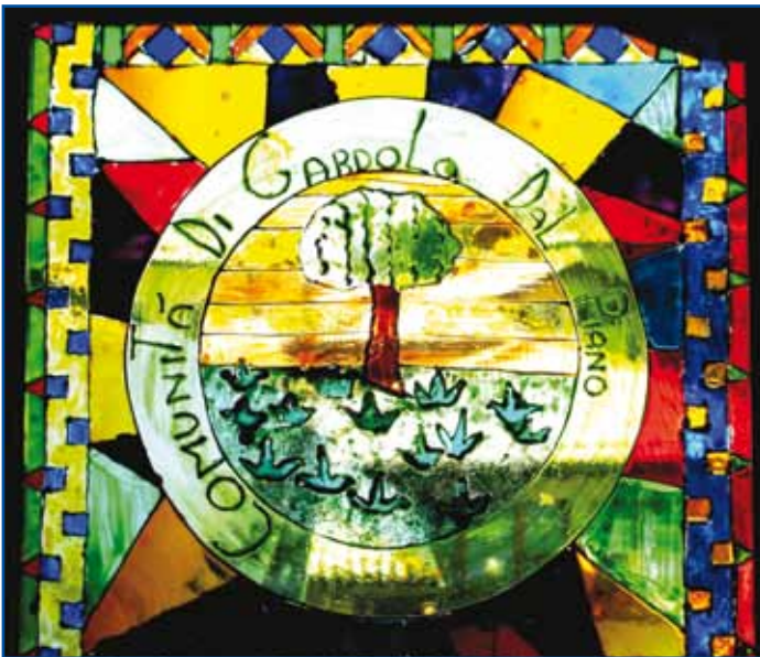
Uno scorcio delle vetrate colorate

sivo Trento 7, Circolo Pensionati e Anziani "Il Caminetto", Gruppo A.N.A. di Gardolo. Pubblichiamo anche un piccolo reportage fotografico invitando chi non avesse già visto i lavori dal vivo a farlo personalmente.