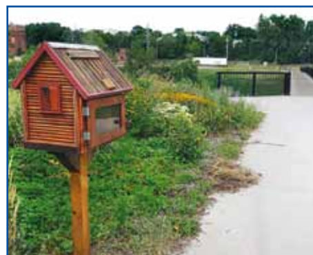
Alcuni esempi di Little Free Library nel mondo