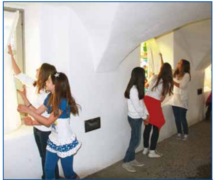
Si "scoprono" i lavori