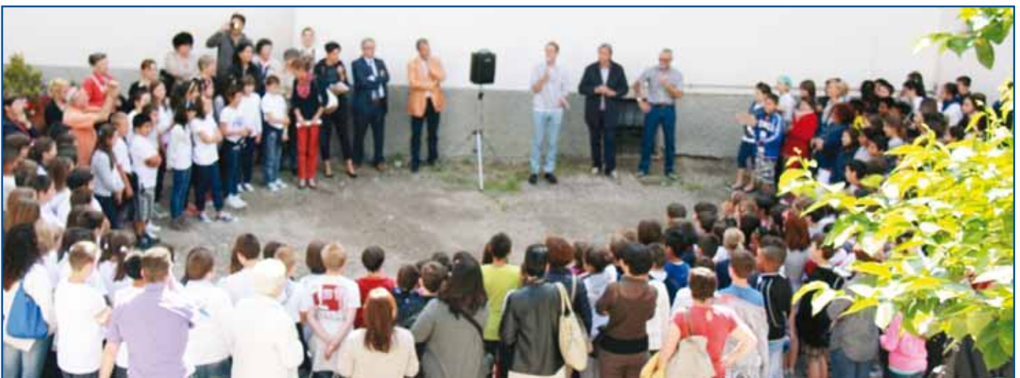
Gran folla di bambini (e genitori) all'inaugurazione

Al termine dell'inaugurazione, nella corte di Palazzo Crivelli, è seguito un intrattenimento musicale a cura degli studenti delle Scuole Medie Pedrolli ed un rinfresco. Quello che più ha colpito le persone presenti è stato il coinvolgimento dei ragazzi delle quinte elementari nel progetto. Lo hanno illustrato e ne hanno evidenziato il senso: lasciare una traccia per farsi trovare, farsi riconoscere. Premessa per un senso di cittadinanza attiva che sappia prendersi cura e rispettare il bene comune.