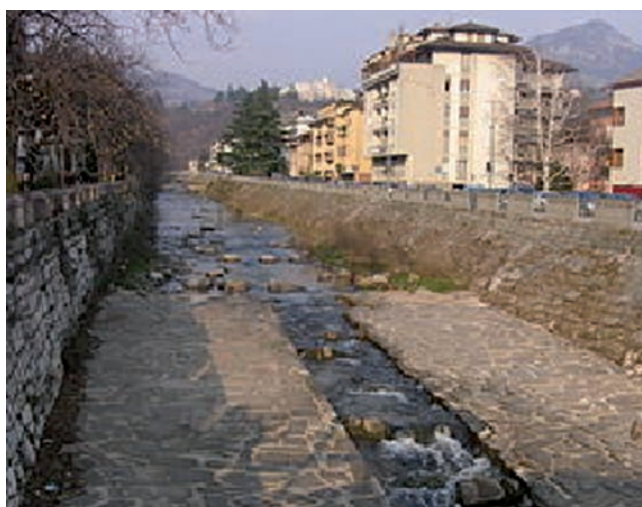
Il Fersina dal Ponte dei Cavalleggeri a Trento

risolvere il costante pericolo di alluvioni, fa arrivare da Bolzano un perito di ingegneria idraulica per esaminare la possibilità di un intervento su Ponte Alto e per disegnare i nuovi argini del Fersina. L'alveo del torrente viene spostato più a sud e stabilizzato dove si trova oggi. Viene fatta una defini-