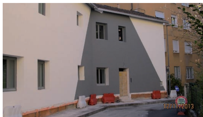
Nuova sede della Circoscrizione San Giuseppe - Santa Chiara