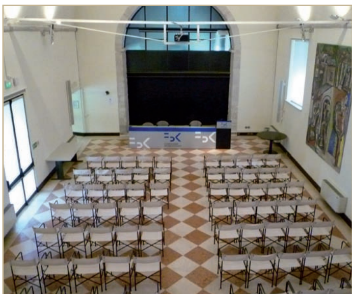
Aula Magna "Fondazione Kessler" che occupa la parte interna dell'antica chiesa

La facciata, costruita con gli originali conci di pietra, ha un ampio oculo centrale ed un portale rinascimentale con architrave e timpano triangolare. Sul retro c'è un rustico campaniletto a cuspide.