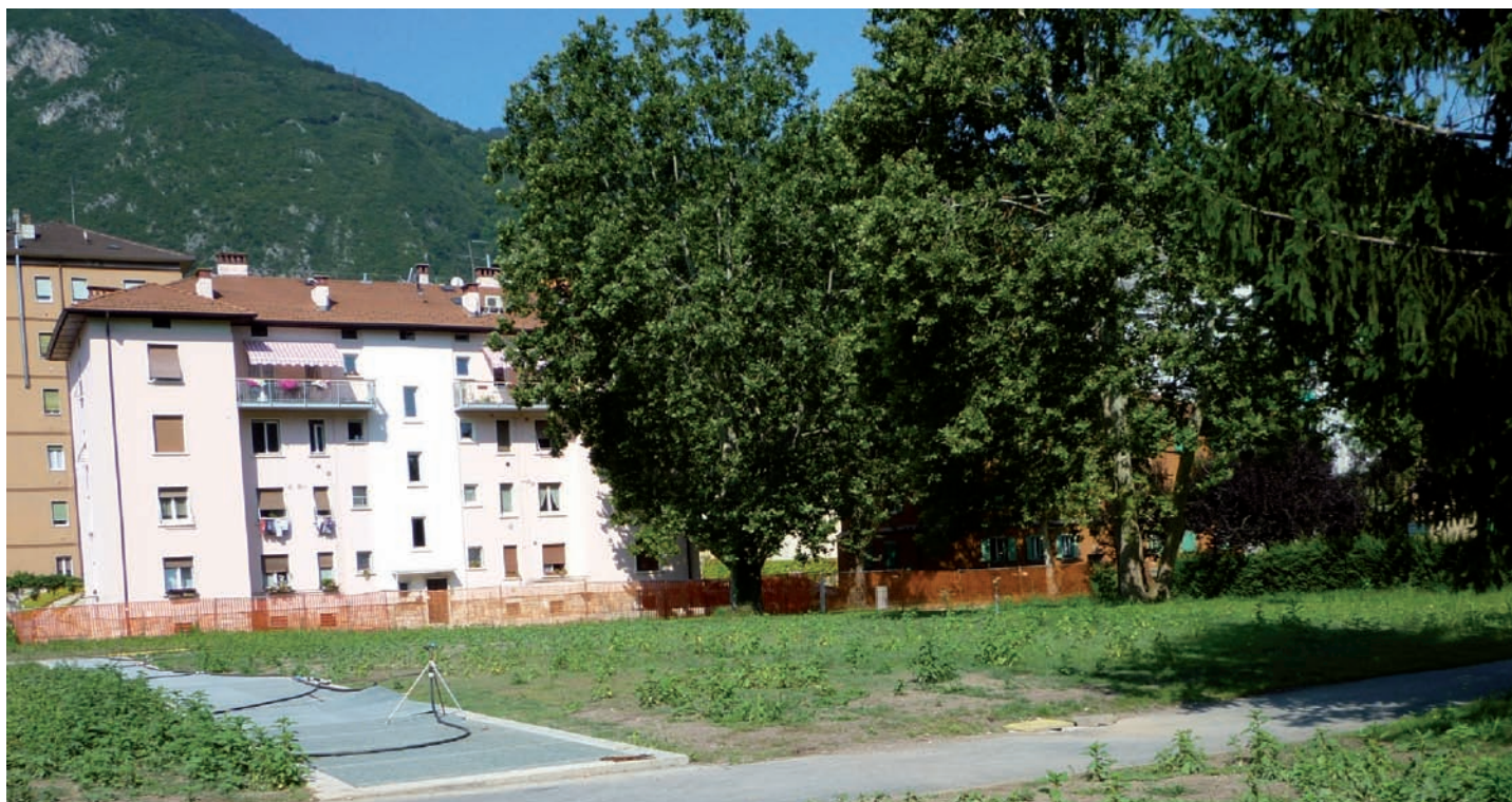
Area Verde ex Duca D'Aosta

Tutte le Circoscrizioni del Comune di Trento, nel mese di luglio, dopo un'attenta analisi dei bisogni e delle problematiche del proprio territorio, propongono all'amministrazione comunale quegli interventi che ritengono prioritari e che l'amministrazione stessa valuterà nel momento della stesura del bilancio comunale per l'anno successivo.