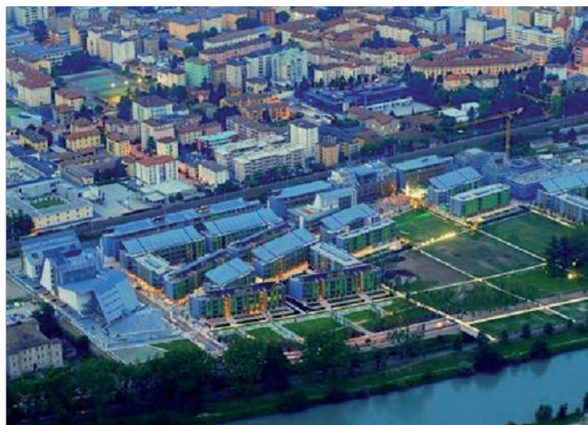
Vista del quartiere dall'alto

da parte di esponenti politici e finanziari, il risultato della collaborazione fra pubblico e privato, che ha prodotto questa eccellente riqualificazione urbana.