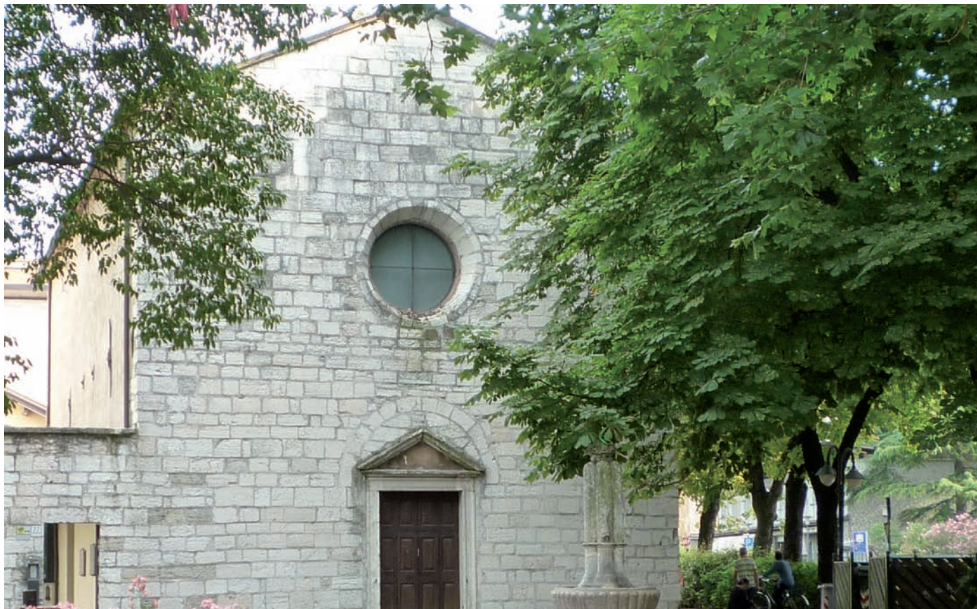
La chiesa di Santa Croce