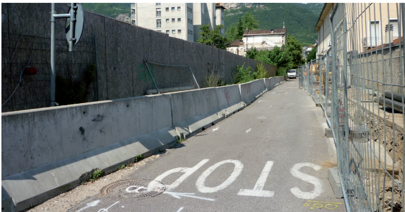
Via San Giovanni Bosco

In ultimo e in merito alla realizzazione di nuove infrastrutture sul territorio, si chiede vengano realizzate le opere già finanziate negli esercizi di bilancio degli anni scorsi e che individuino rapidamente soluzioni alternative per rendere fruibili all'ente pubblico e a privati le strutture attualmente in disuso sul territorio circoscrizionale.