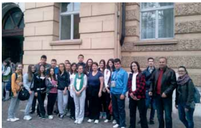
GIOVANI DEL GEMELLAGGIO DAVANTI ALLA SCUOLA MANZONI