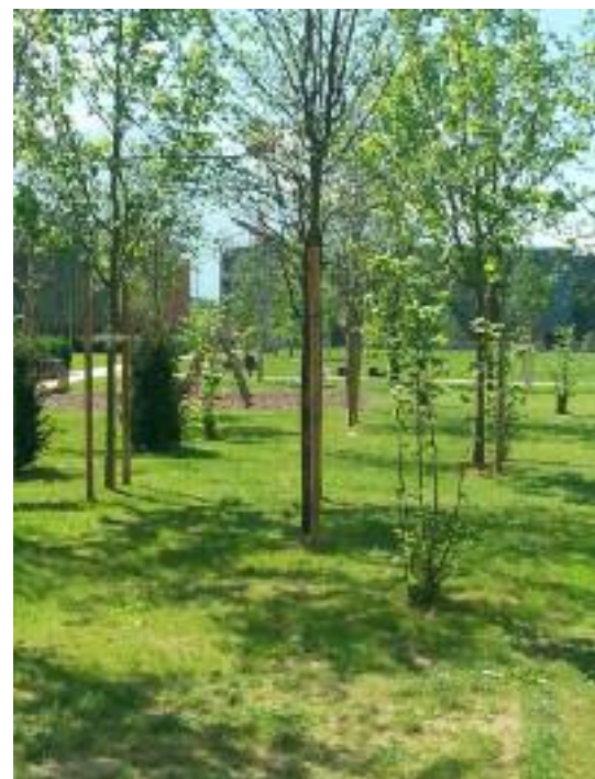
I giardini delle Albere

Uscendo dal Muse si entra nel nuovo quartiere della Circoscrizione