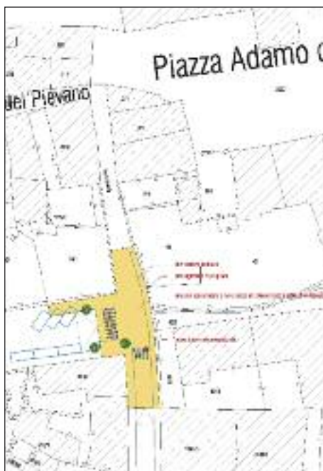
Piantina dell'incrocio via Prati-Via Esterle

L'attraversamento per pedoni e biciclette in prossimità dell'incrocio di via Prati con via Esterle presenta