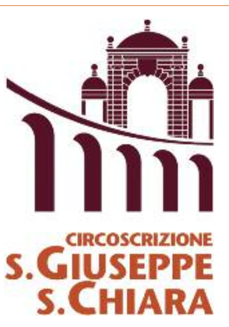
Il logo della Circoscrizione San Giuseppe - Santa Chiara

Il logo proposto dallo studio Neiner riassume pienamente la continuità tra antico e moderno, tra importanti testimonianze storiche e sfide verso il futuro che caratterizza la nostra Circoscrizione e soddisfa totalmente quanto immaginato dai consiglieri circoscrizionali che si sono succeduti nell'ultimo decennio. ■