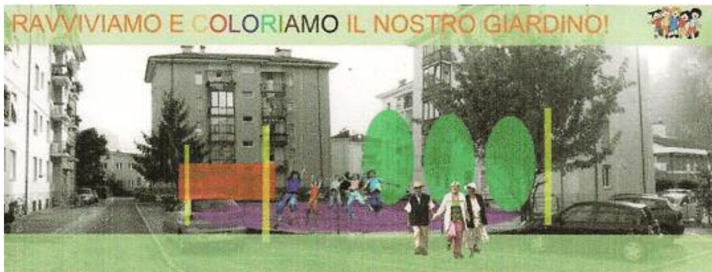
Il futuro giardino di via dei Muredei

Presidente Commissione Urbanistica Territorio e Mobilità Circoscrizione S. Giuseppe - S. Chiara