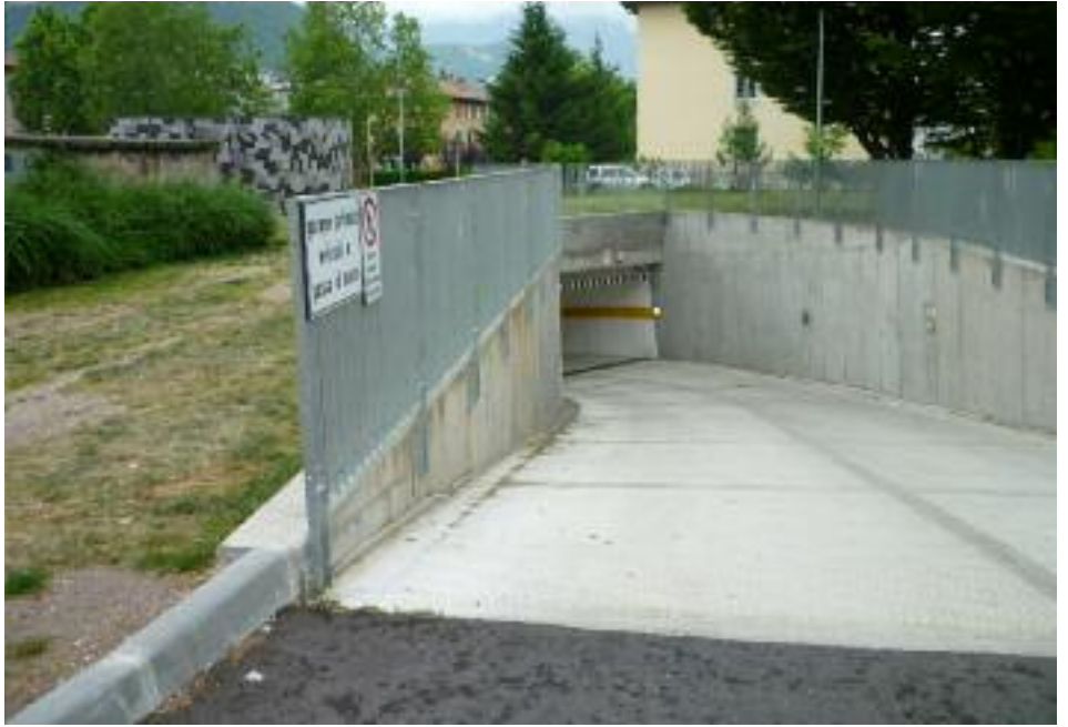
L'attuale ingresso del parcheggio pertinenziale presso l'area delle ex Duca d'Aosta