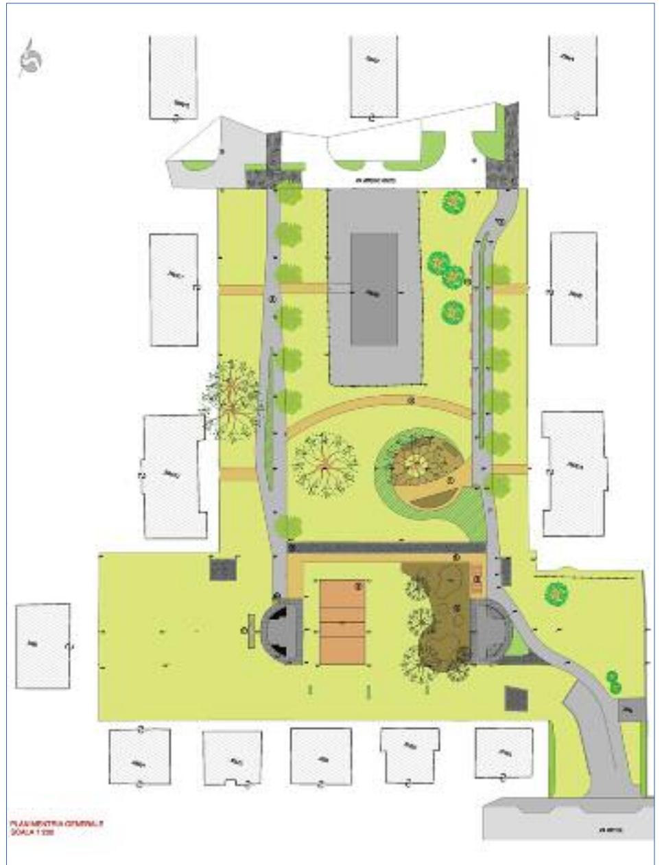
Piantina del nuovo spazio verde nell'area delle ex caserme Duca d'Aosta

In prossimità del corpo scala ovest verrà realizzato un punto per l'allacciamento elettrico da utilizzare