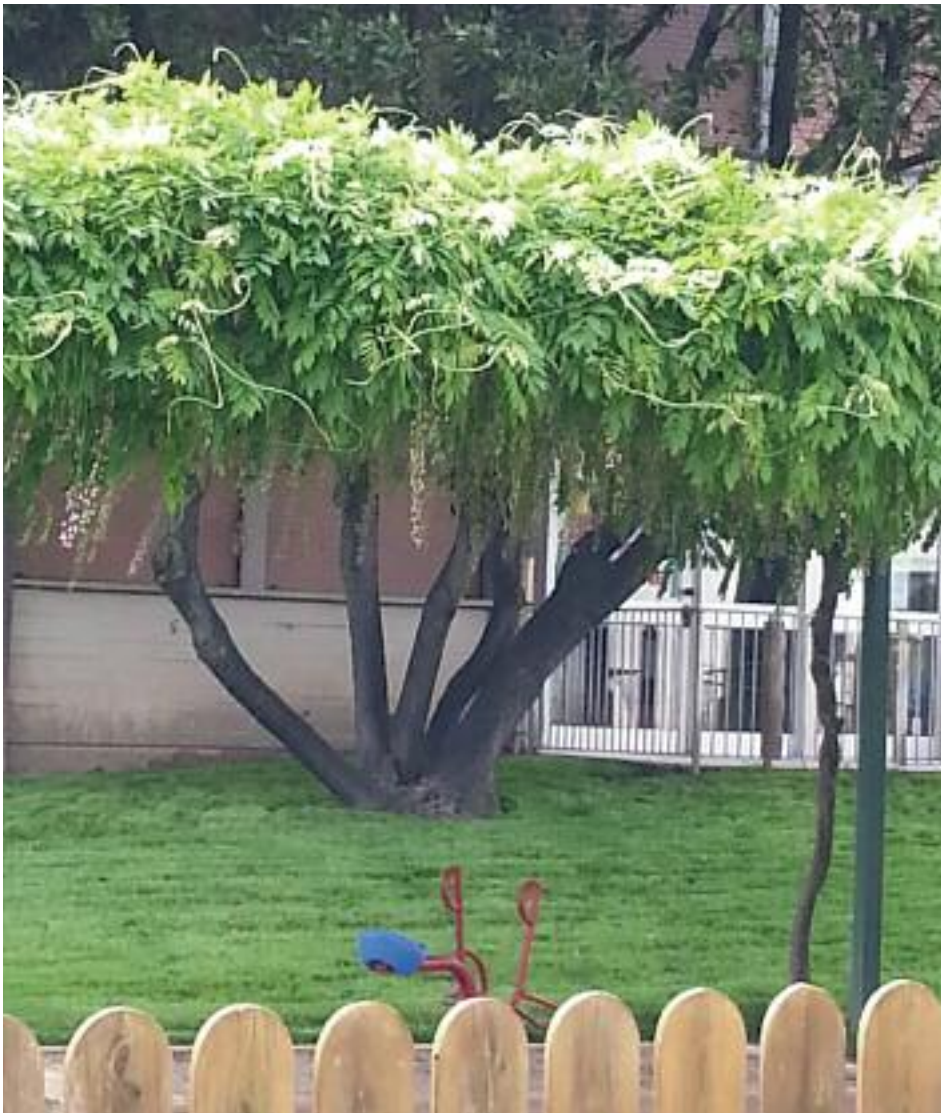
Il giardino dell'asilo Torrione

Il progetto del nuovo Palazzo di Giustizia prevedeva l'unificazione di tutti gli uffici giudiziari presenti a Trento in un unico complesso da realizzare al posto dell'attuale struttura. Le attuali normative prevedono delle drastiche riduzioni delle superfici degli uffici pubblici, quindi si è reso necessario rivedere il progetto. Si informa che nel nuovo studio si prevede anche il recupero con ristrutturazione del vecchio carcere di via Pilati e si garantisce il massimo impegno per raggiungere l'obiettivo di realizzare il nuovo Palazzo di Giustizia anche se ridimensionato. Appare prematuro indicare oggi precisi tempi di costruzione del complesso edificale. ■