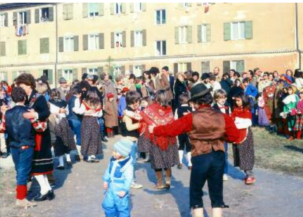
Momenti di festa, fine anni '60

Le loro rivendicazioni, però, riguardavano la stretta area delle ex caserme e non contemplava il disagio che tale progetto avrebbe procurato alle vie circostanti. Per questo, negli stessi giorni, un privato cittadino di via Matteotti si metteva in campo per far passare il concetto che il problema parcheggio non era limitabile a un'area, ma era certamente un problema di tutto il rione. Iniziò nel 1989 un nuovo lungo periodo di attesa e speranza, perciò si ritiene opportuno ricordarne alcuni passaggi importanti.