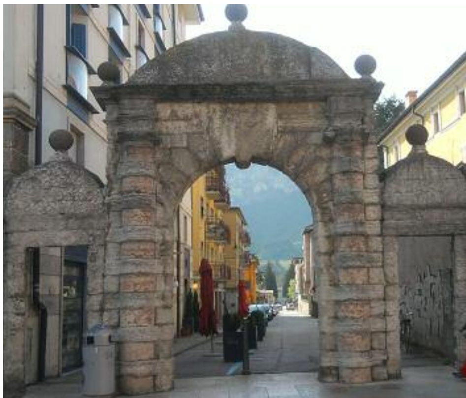
I Tre Portoni

Il parco di circa cinque ettari, un polmone verde che si estende nella zona centrale dell'area, occupando circa il 40% dell'intero quartiere, diventa l'elemento principale della fusione armonica con il paesaggio circostante. ■